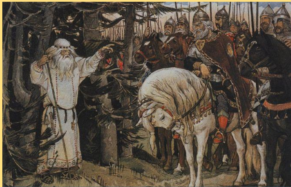
В. М. Васнецов "Вещий Олег"