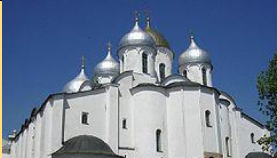
Собор святой Софии