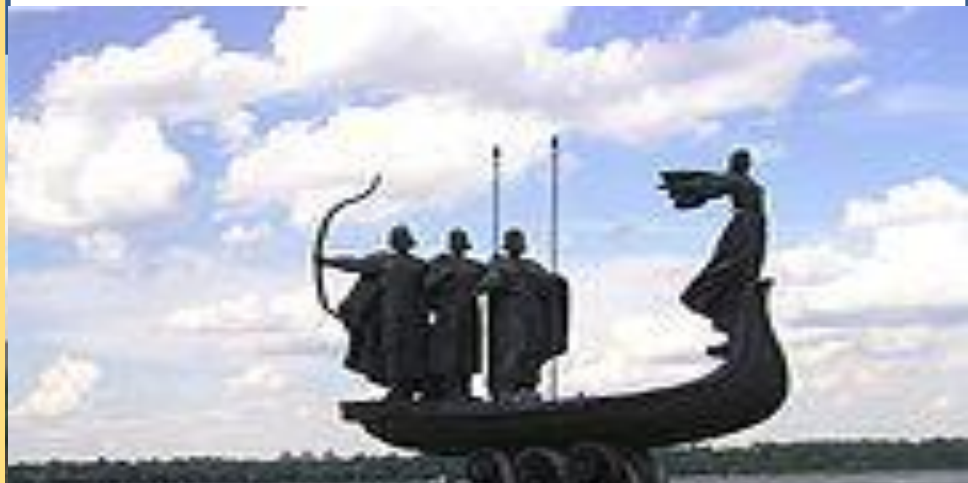
Памятник основателям Киева