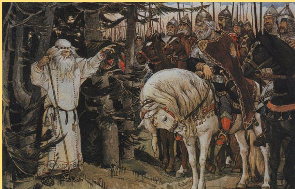
В. М. Васнецов "Вещий Олег"