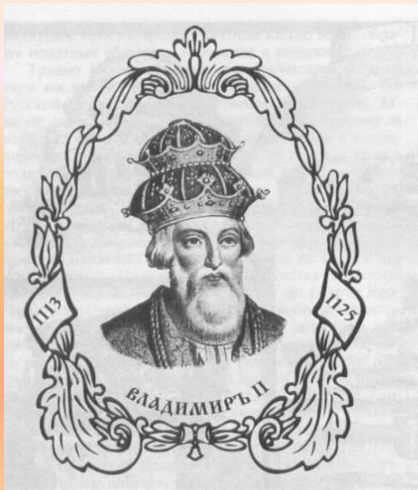
Князь Владимир Мономах

«Что знаете хорошего, того не забывайте; Чего не знаете, тому учитесь, не ленитесь ни на что доброе...»