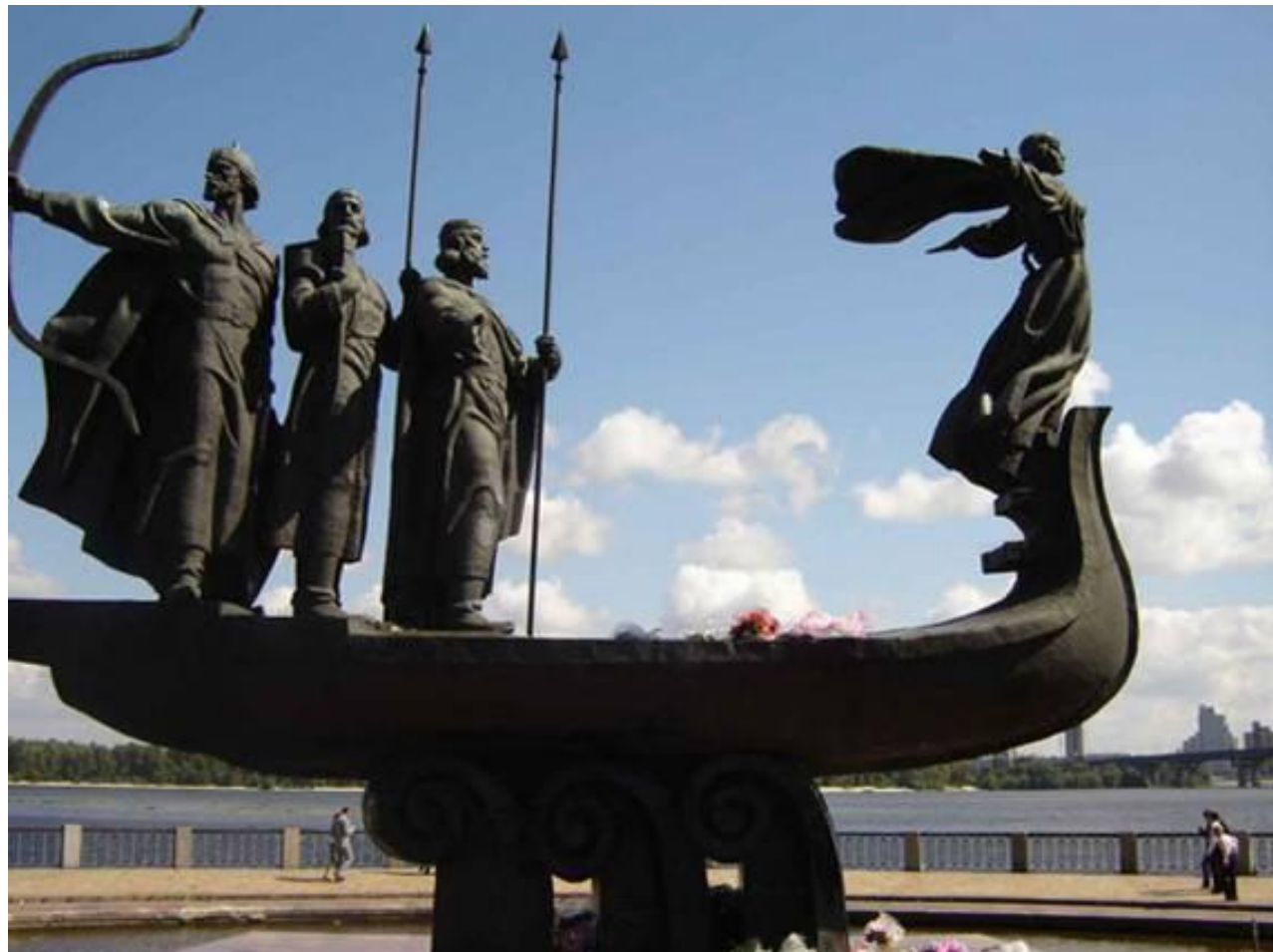
Памятник Киево, Щеку, Хориву и Лыбеди

С тех пор минуло много лет. Пришли на холмы три брата - Кий, Щек и Хорев, и с ними сестра их Лыбедь. Предание говорит, что Кий был перевозчиком через речку Днепр. По его имени называли эту местность Киев перевоз (т.е., другими словами – Перевоз Кия ). А потом так стали называть и город, который вырос на этом месте. Город рос, развивался... а имя его наоборот уменьшилось. Где-то в глубинах истории потерялось слово «перевоз» и осталось только слово «Киев».