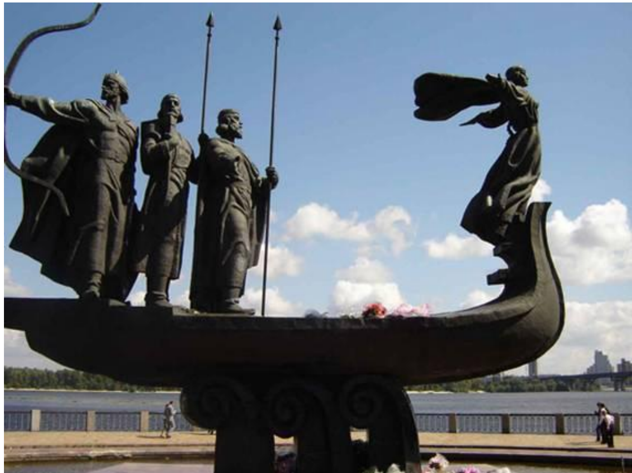
Памятник Киево, Щеку, Хориву и Лыбеди

С тех пор минуло много лет. Пришли на холмы три брата - Кий, Щек и Хорев, и с ними сестра их Лыбедь. Предание говорит, что Кий был перевозчиком через речку Днепр. По его имени называли эту местность Киев перевоз (т.е., другими словами – Перевоз Кия ). А потом так стали называть и город, который вырос на этом месте. Город рос, развивался... а имя его наоборот уменьшилось. Где-то в глубинах истории потерялось слово «перевоз» и осталось только слово «Киев».