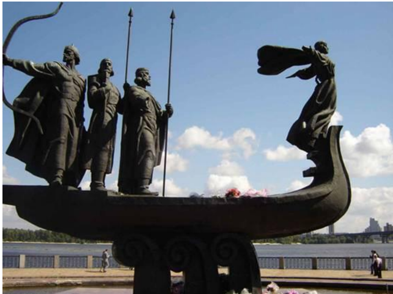
Памятник Кию, Щеку, Хориву и Лыбеди

С тех пор минуло много лет. Пришли на холмы три брата - Кий, Щек и Хорев, и с ними сестра их Лыбедь. Предание говорит, что Кий был перевозчиком через речку Днепр. По его имени называли эту местность Киев перевоз (т.е., другими словами – Перевоз Кия ). А потом так стали называть и город, который вырос на этом месте. Город рос, развивался... а имя его наоборот уменьшилось. Где-то в глубинах истории потерялось слово «перевоз» и осталось только слово «Киев».