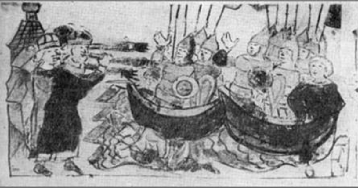
Поход Игоря на Константинополь. Миниатюра из Радзивилловской летописи.

В 941 г., спустя 30 лет после договора Олега с Византией, киевский князь Игорь двинулся в поход на Константинополь.