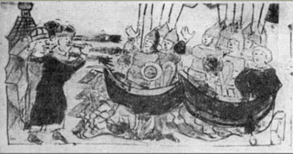
Поход Игоря на Константинополь. Миниатюра из Радзивилловской летописи.

В 941 г., спустя 30 лет после договора Олега с Византией, киевский князь Игорь двинулся в поход на Константинополь.