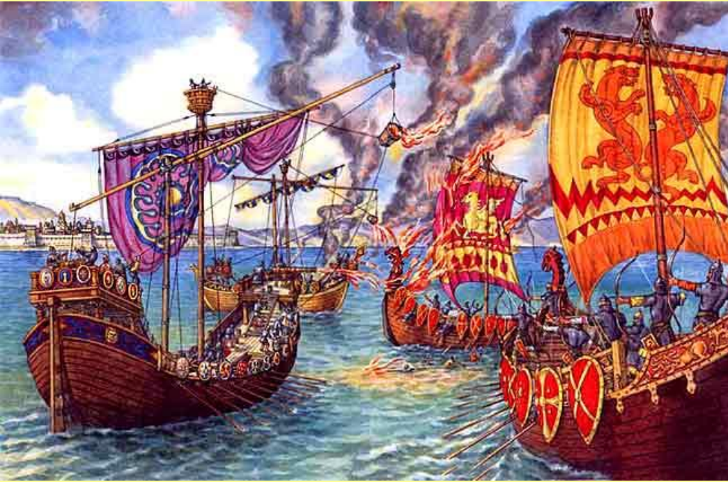
Битва Игоря с византийцами. Худ. В. Иванов.

Пламя, охватившее ладьи и бросавшихся в море людей, внушило русским воинам такой ужас, что, вернувшись домой, они рассказывали, будто греки обрушили на них молнии небесные.