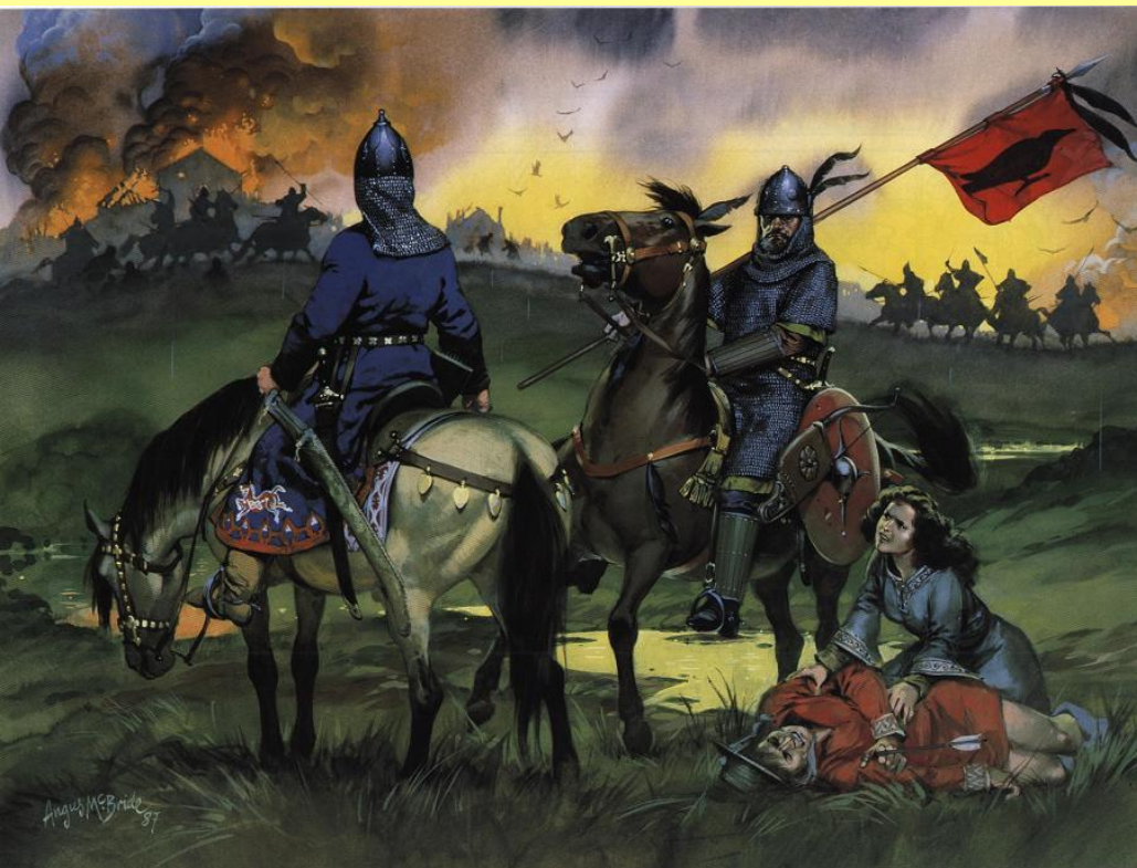
Набег кочевников. Современный рисунок.

С востока и юго-востока Руси постоянно угрожали набеги кочевников. В 898 г. окрестности Киева разграбили шедшие с востока племена угров. Взяв с киевлян дань, они ушли на запад и осели на территории современной Венгрии.