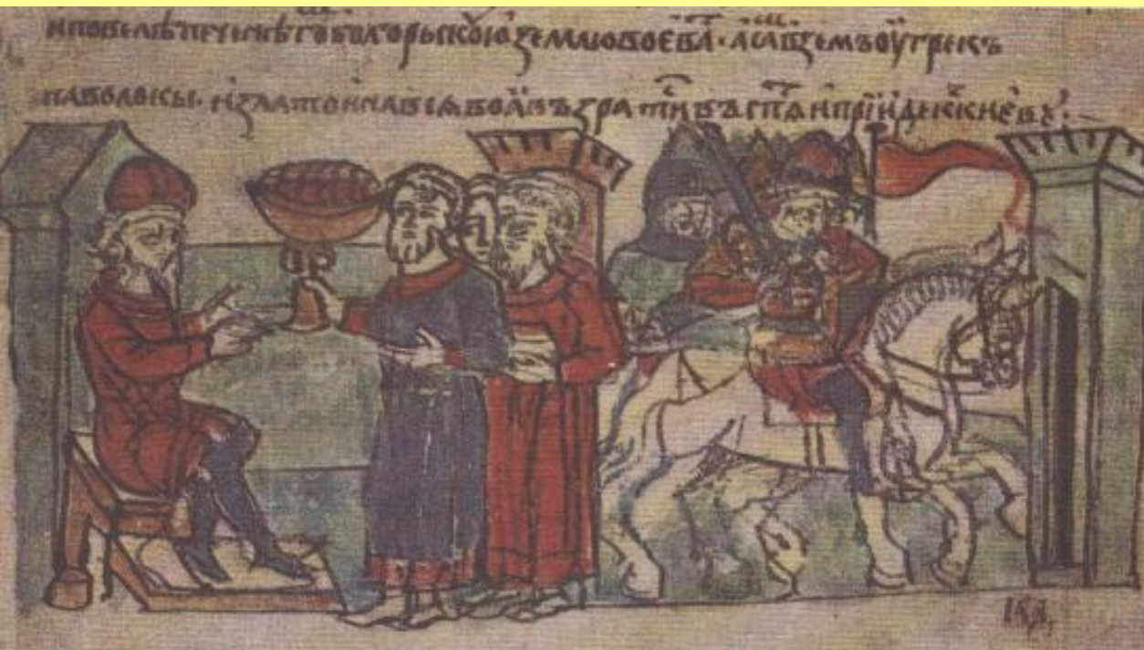
Византийские послы просят мира. Миниатюра из Радзивилловской летописи.

Император прислал к Игорю послов со словами: «Не ходи к граду, но возьми дань, юже имал Олег, придам и еще к той дани». Князь обратился к дружине за советом.