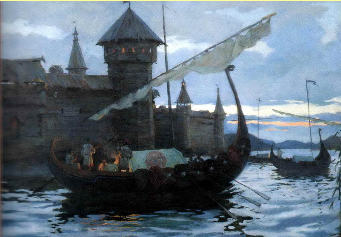
Славяне в походе. Худ В.А. Нагорнов.

В 907 г. Олег совершил поход на Царьград (Константинополь).