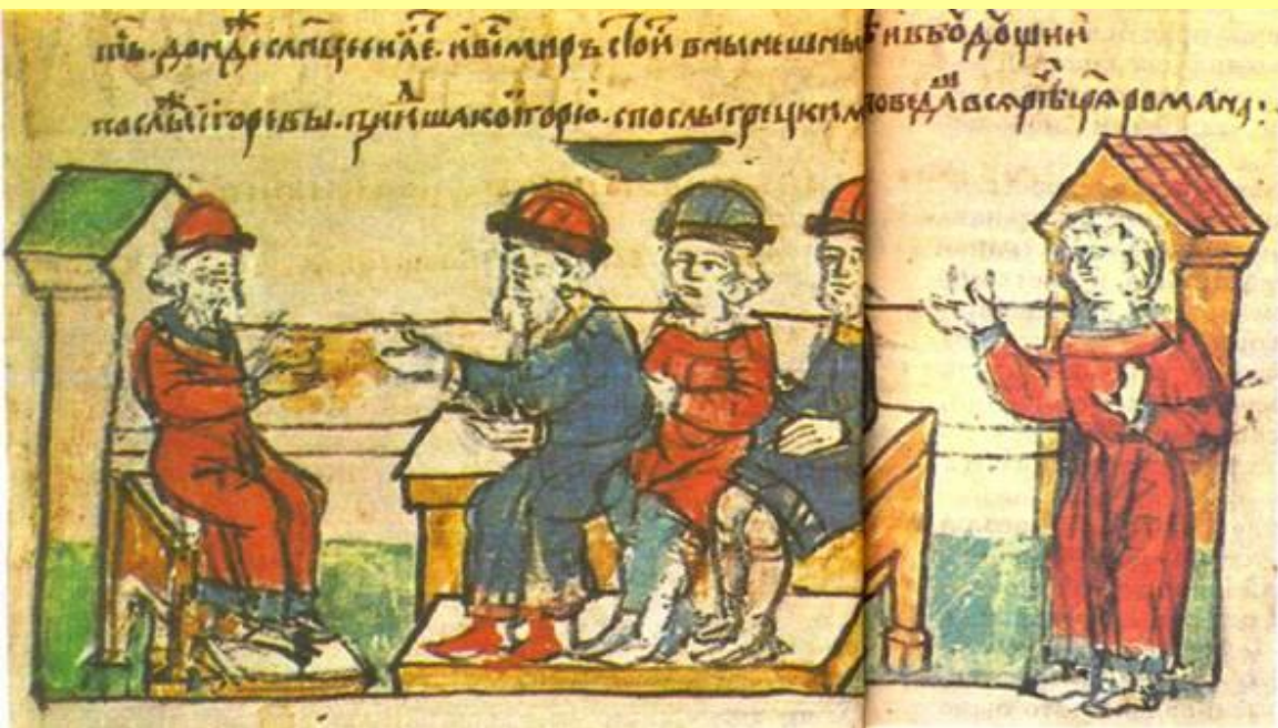
Заключение мирного договора. Миниатюра из Радзивилловской летописи.