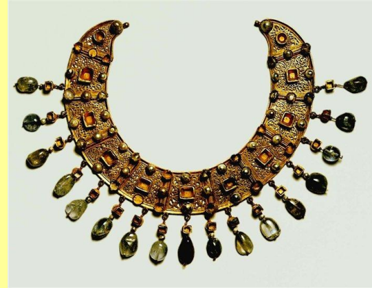
Византийские ювелирные изделия