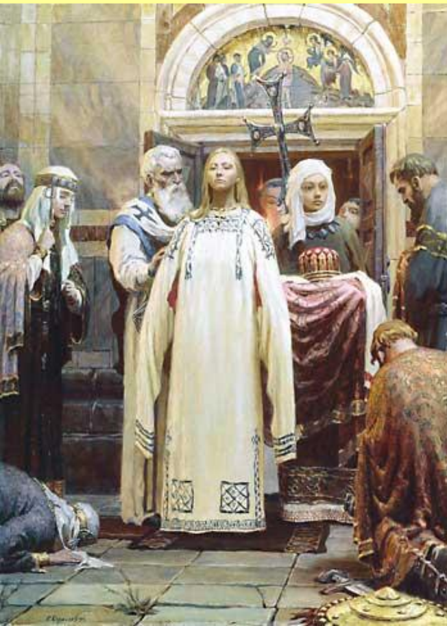
Святая равноапостольная княгиня Ольга (крещение). Худ. С.А. Кириллов.

Новый этап отношений между Русью и Византией наступил при княгине Ольге.