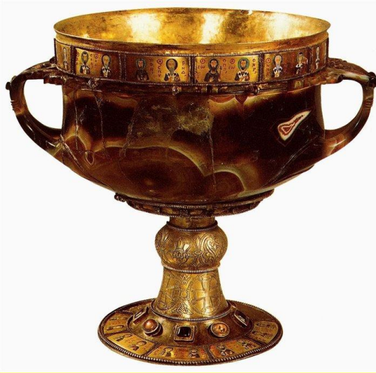
Византийские ювелирные изделия

Стремление захватить эти богатства побуждало их совершать набеги на Византию так же, как в III–V вв. германцы совершали набеги на Римскую империю.