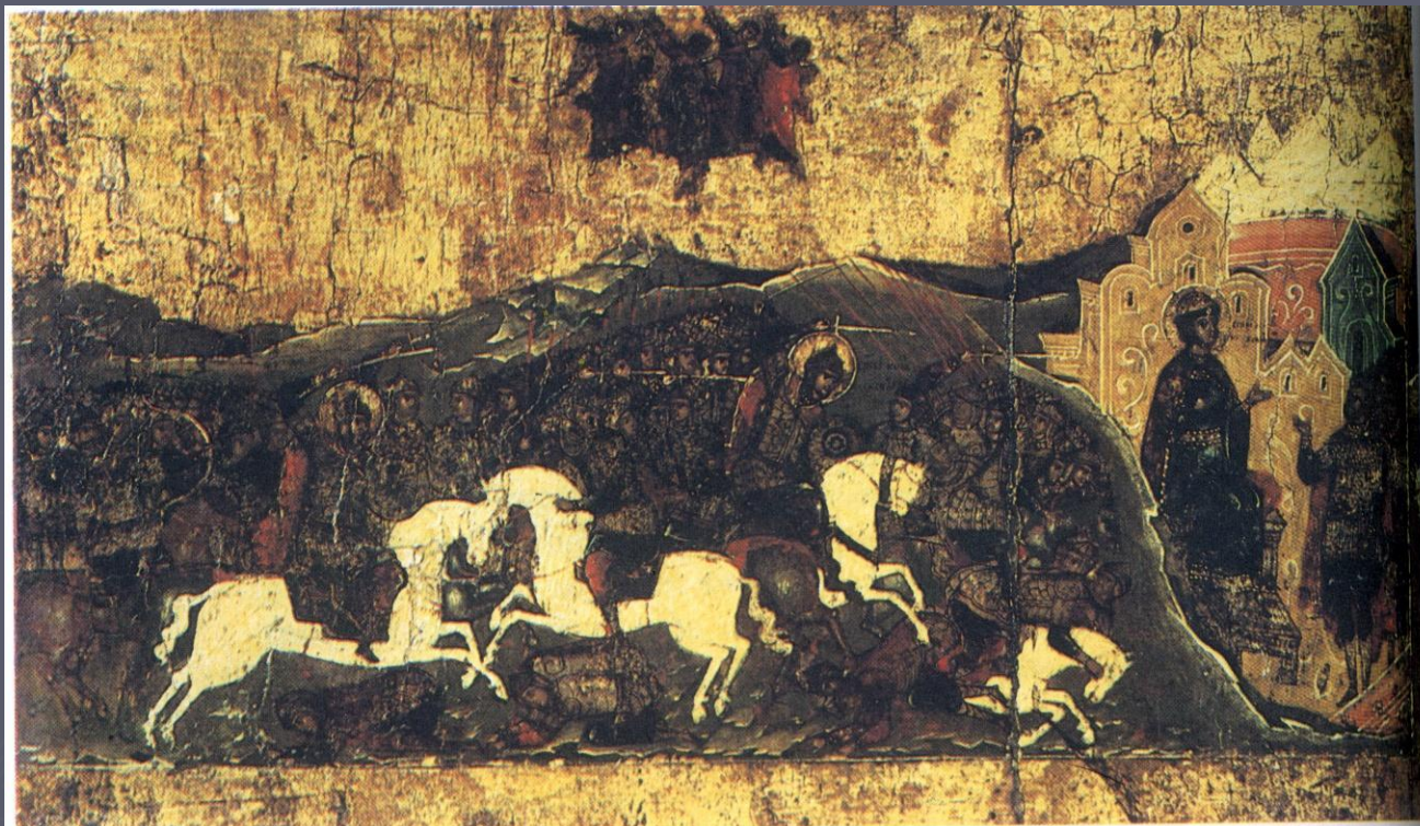
Невская битва 1240 г. Фрагмент старинной иконы