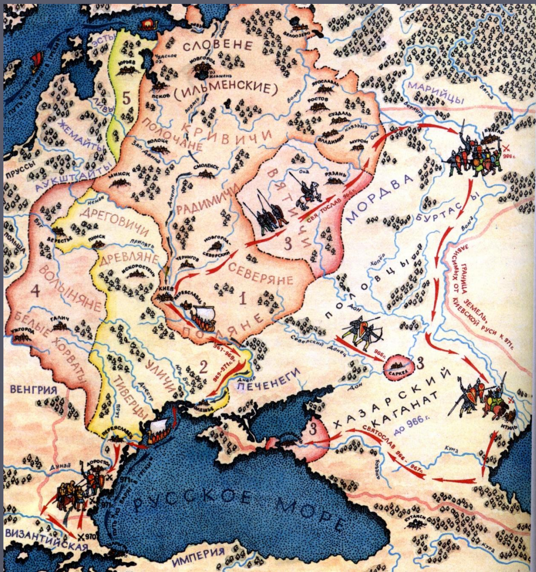
Киевская Русь IX – XI веков.