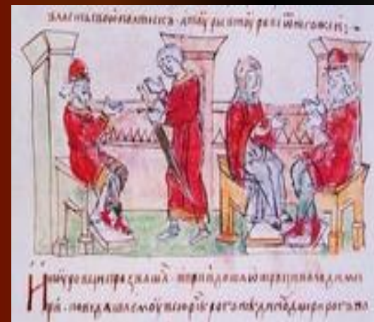
Сватовство Владимира к Рогнеде ( миниатюра из Радзивилловской летописи)