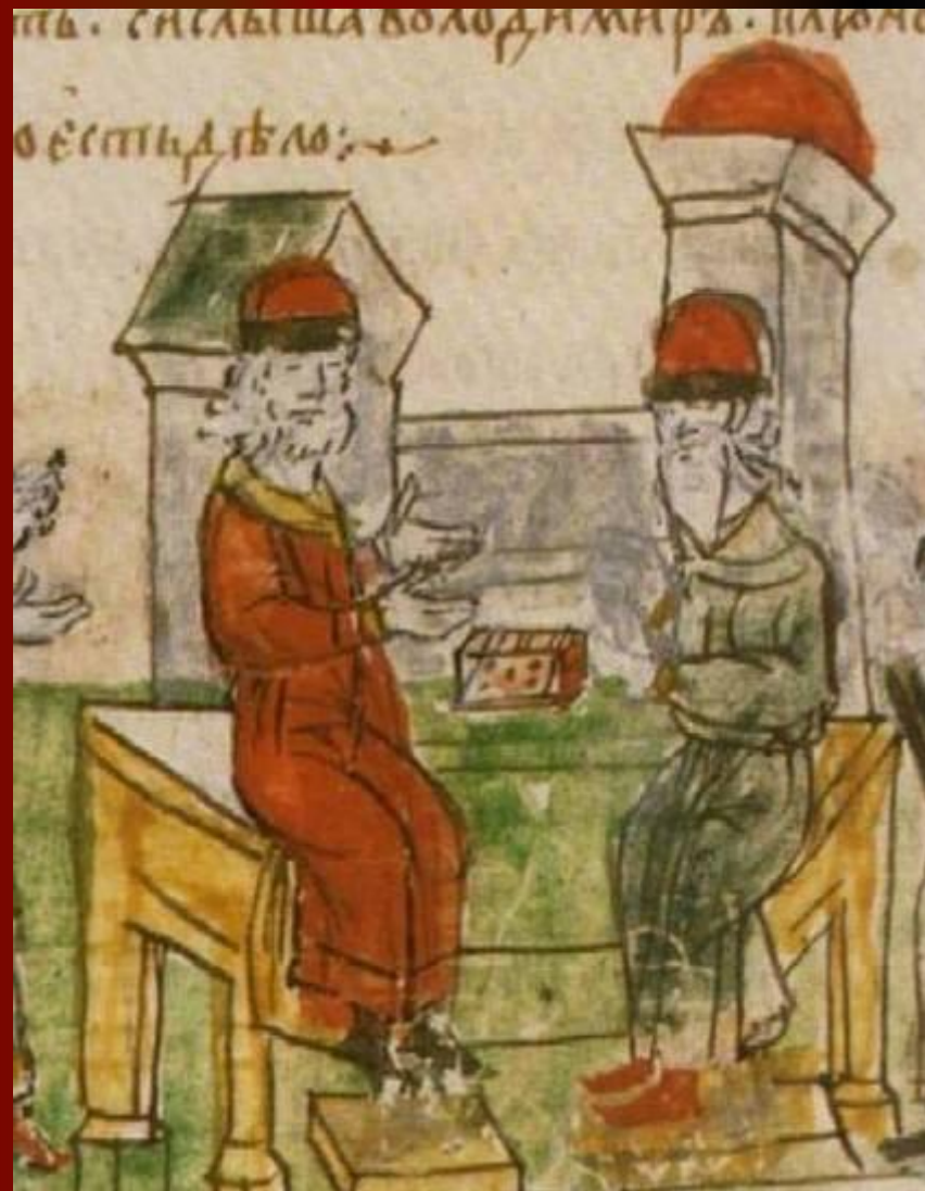
Беседа с греческим философом