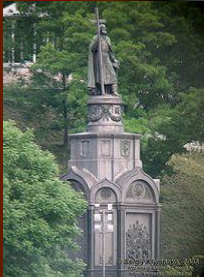
Памятник Владимиру В Киеве.