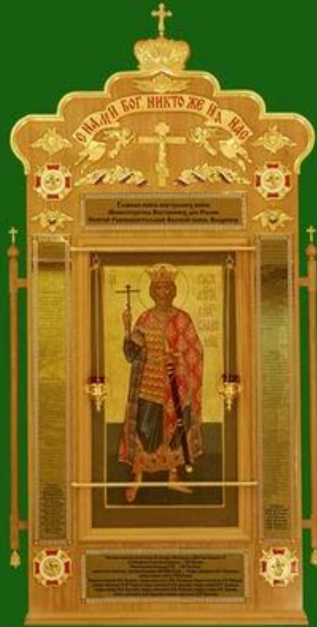
ПО БЛАГОСЛОВЕНИЮ СЯТЕЙШЕГО ПАТРИАРХА МОСКОВСКОГО И ВСЕЯ РУСИ АЛЕКСИЯ II ИЗГОТОВЛЕНА И ОСВЯЩЕНА ГЛАВНАЯ ИКОНА ВНУТРЕННИХ ВОЙСК МВД РОССИИ "СВЯТОЙ РАВНОАПОСТОЛЬНЫЙ ВЕЛИКИЙ КНЯЗЬ ВЛАДИМИР"