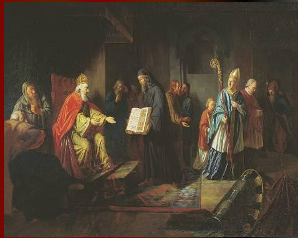
Выбор веры князем Владимиром

"Повесть временных лет" рассказывает, что в 986 г. в Киеве появились представители всех трёх перечисленных стран, предлагая Владимиру принять их веру. Ислам был отвергнут князем, поскольку ему показалось чересчур обременительным воздержание от вина, иудаизм - из-за того, что исповедовавшие его евреи лишились своего государства и были рассеяны по всей земле. Отверг князь и предложение перейти в веру, сделанное посланцами папы римского. Проповедь же представителя византийской церкви произвела на князя самое благоприятное впечатление.