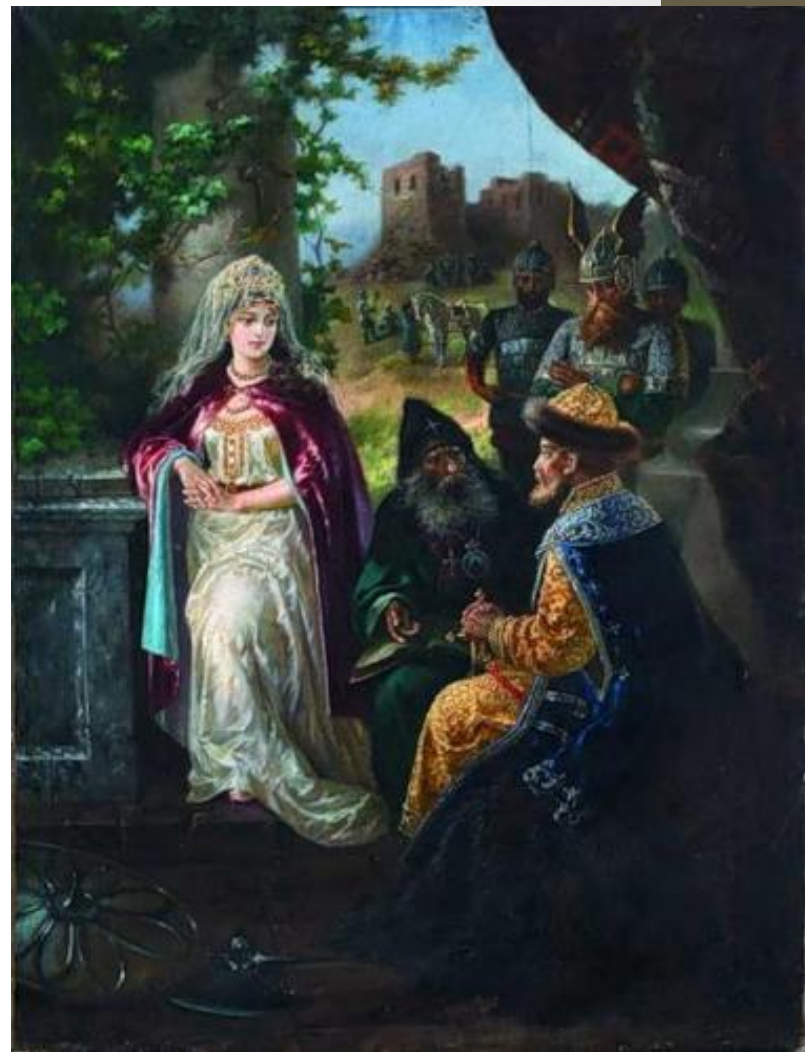
Ярослав Мудрый и шведская принцесса Ингигерда