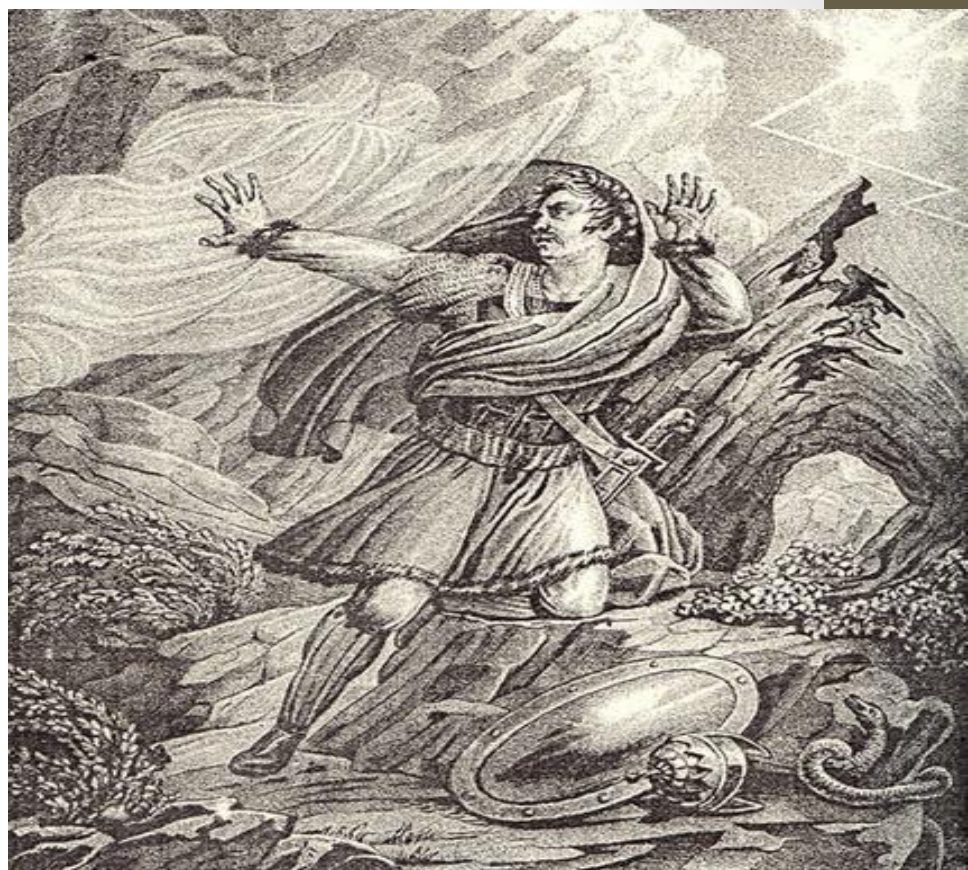
Бегство Святополка. Художник – Б.А. Чериков