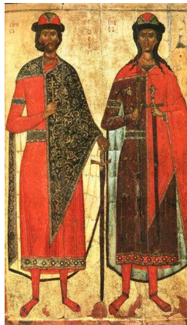
Борис и Глеб

Святополк, поддержанный киевлянами убивает Бориса и Глеба. Занимает Киевский престол