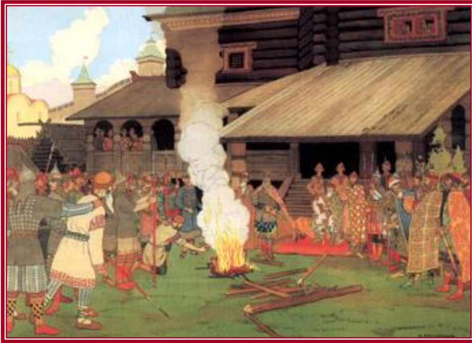
И.Я.Билибин Суд во времена «Русской правды»

Лучшим доказательством вины считалось добровольное признание. Если подозреваемый не признавал вины, ему назначали испытание. Он должен был или вытащить из кипящей воды предмет, или взять раскалённое железо. По тому, как заживала рана, определяли его вину.