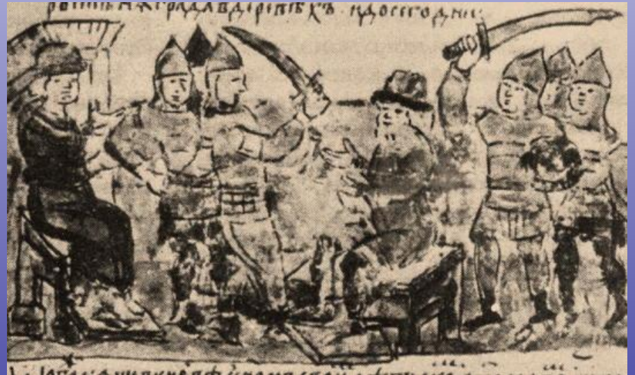
Убийство князя Игоря древлянами