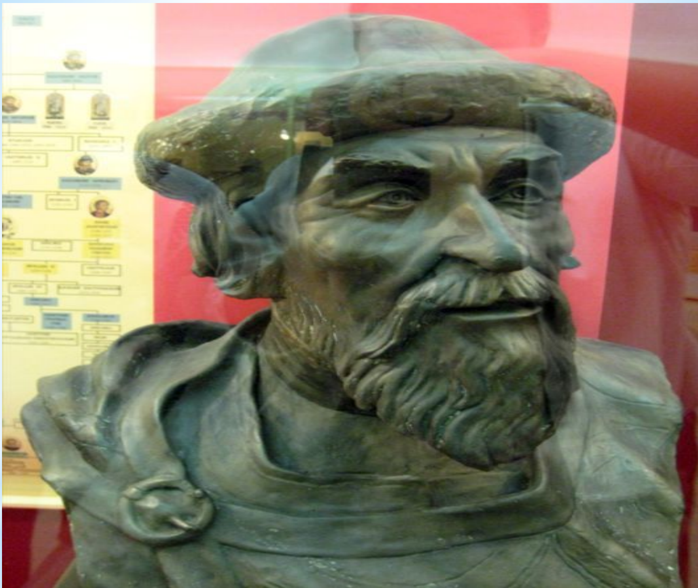
Князь Ярослав Мудрый