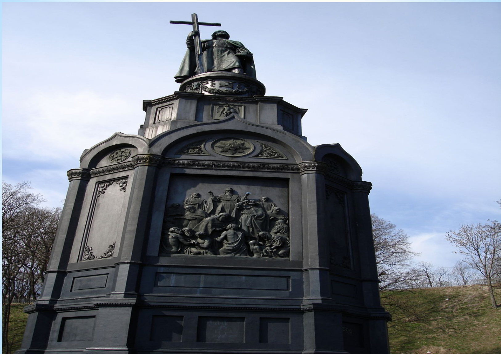
Памятник Владимиру в Киеве