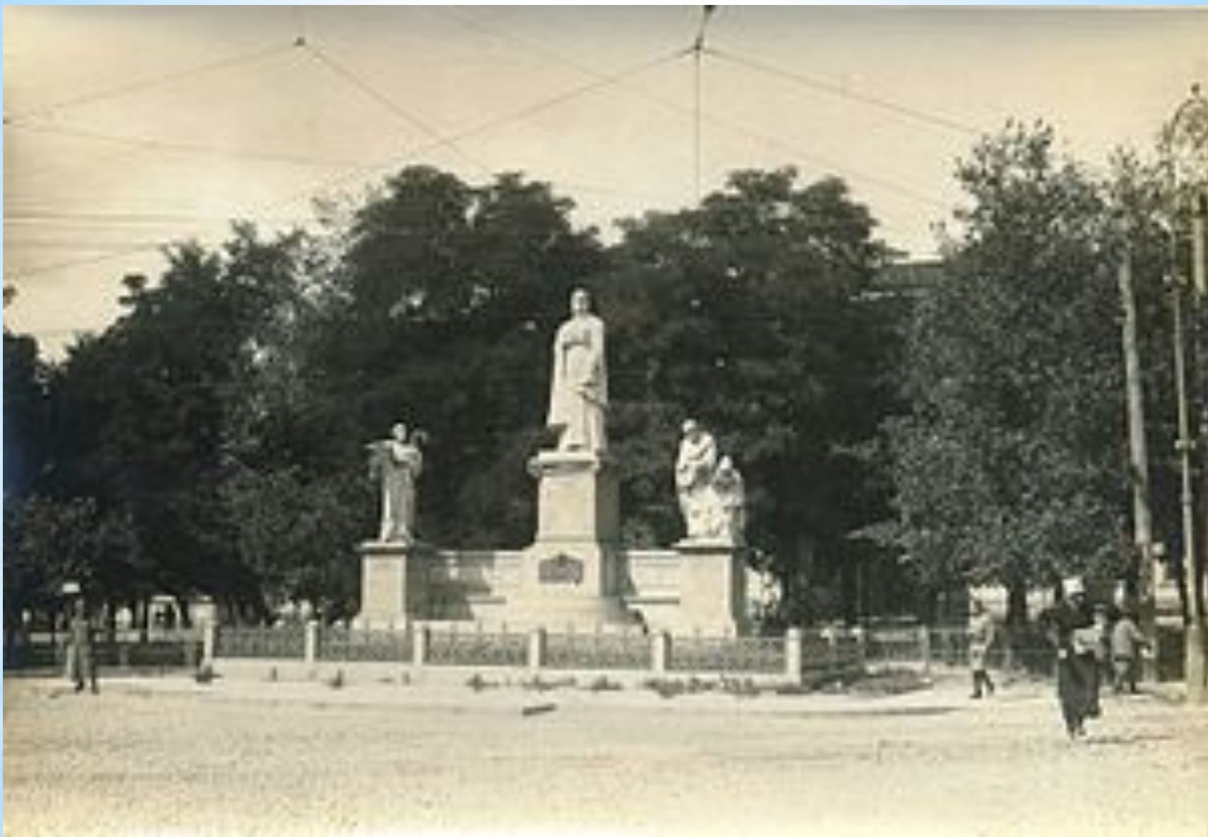
Памятник княгине Ольге в Киеве