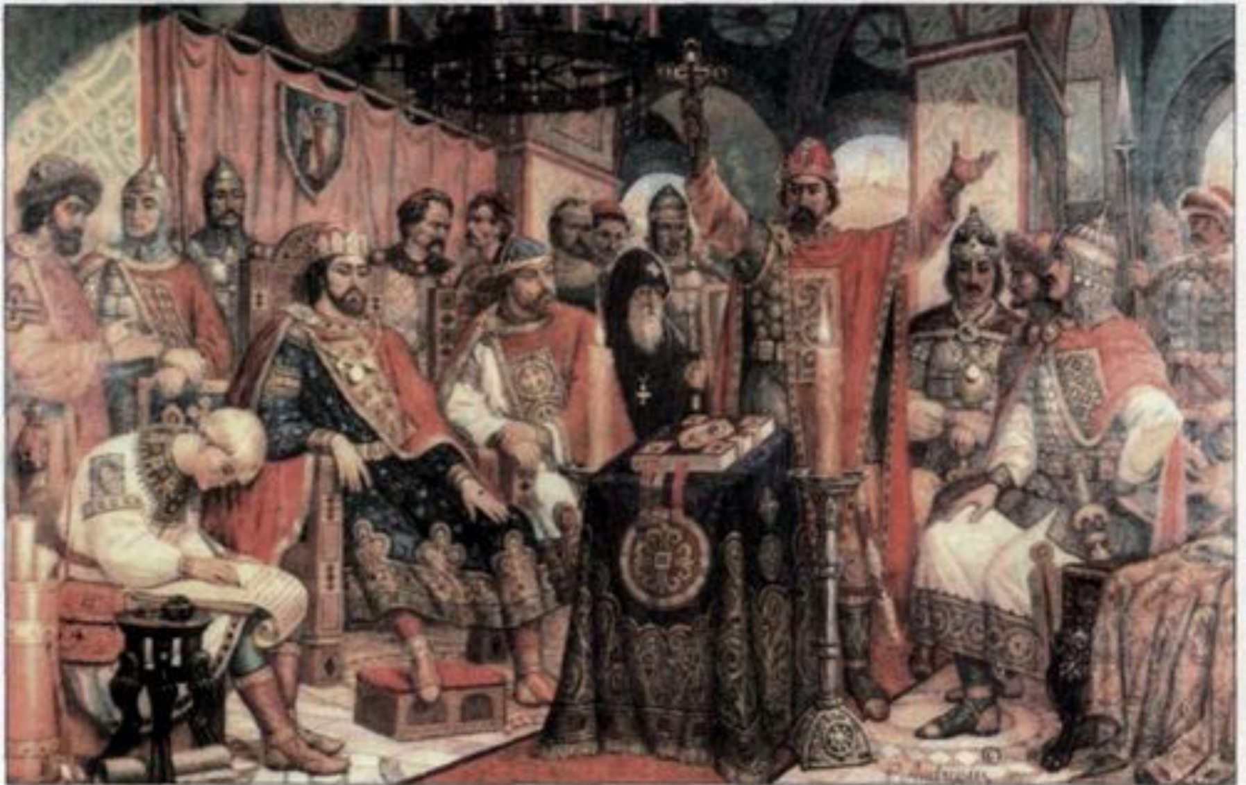
З'їзд руських князів. Картина П. Андрусіва.