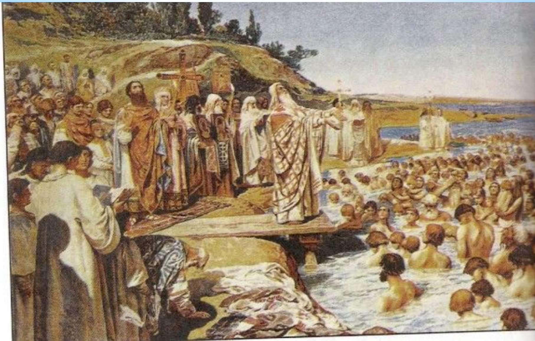
Крещение в Киеве