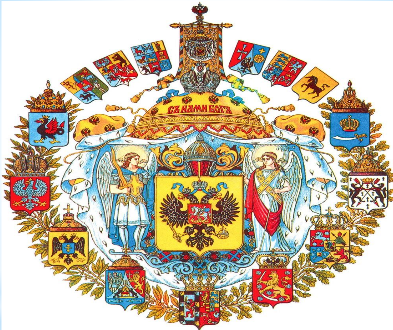
Герб Киевской Руси