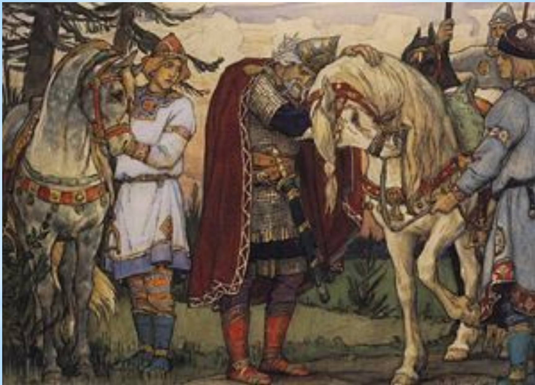
Прощание Вещего Олега с конем