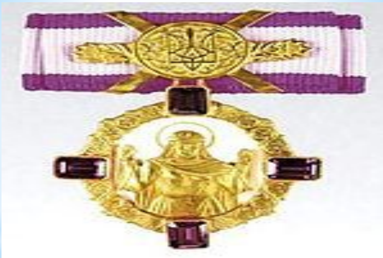
Орден княгини Ольги / степени