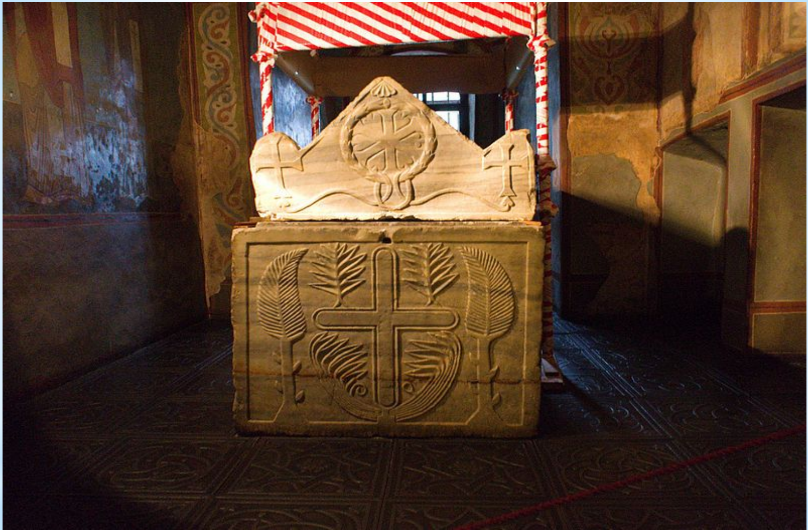
Саркофаг Ярослава Мудрого