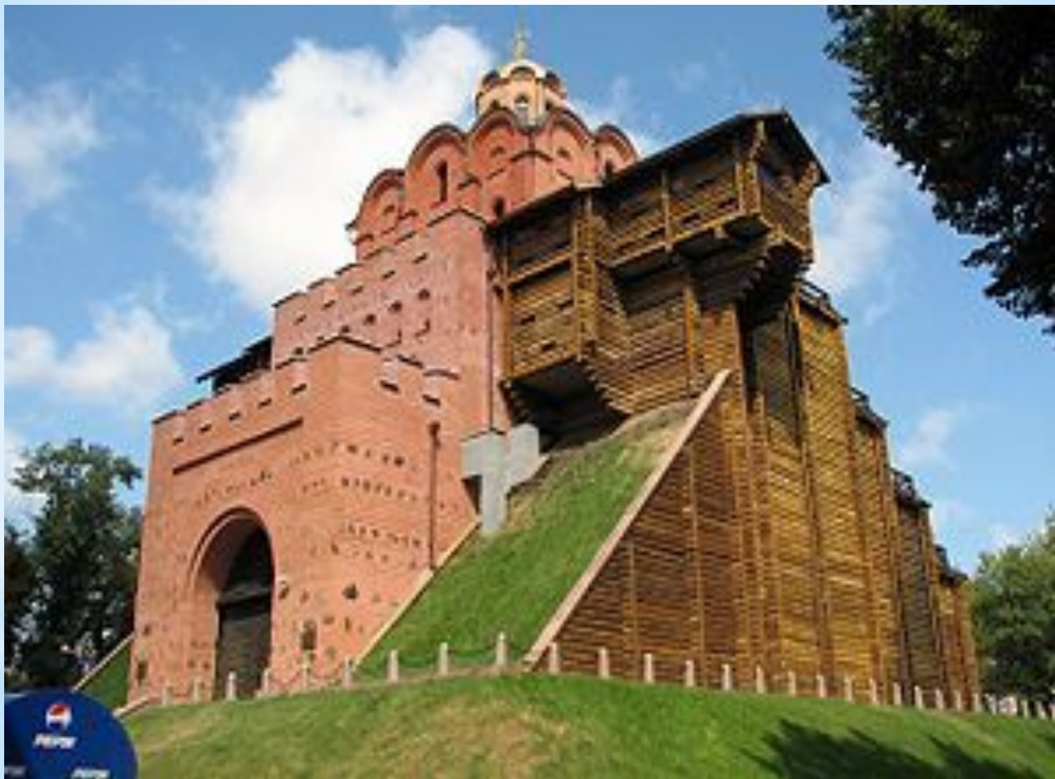
Золотые Ворота в Киеве