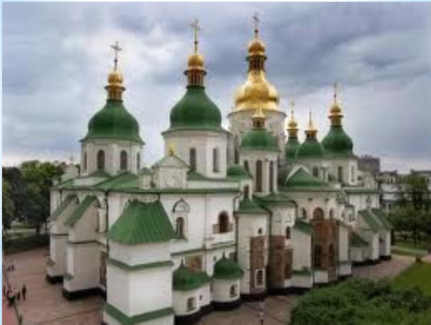
Софийский Собор в Киеве