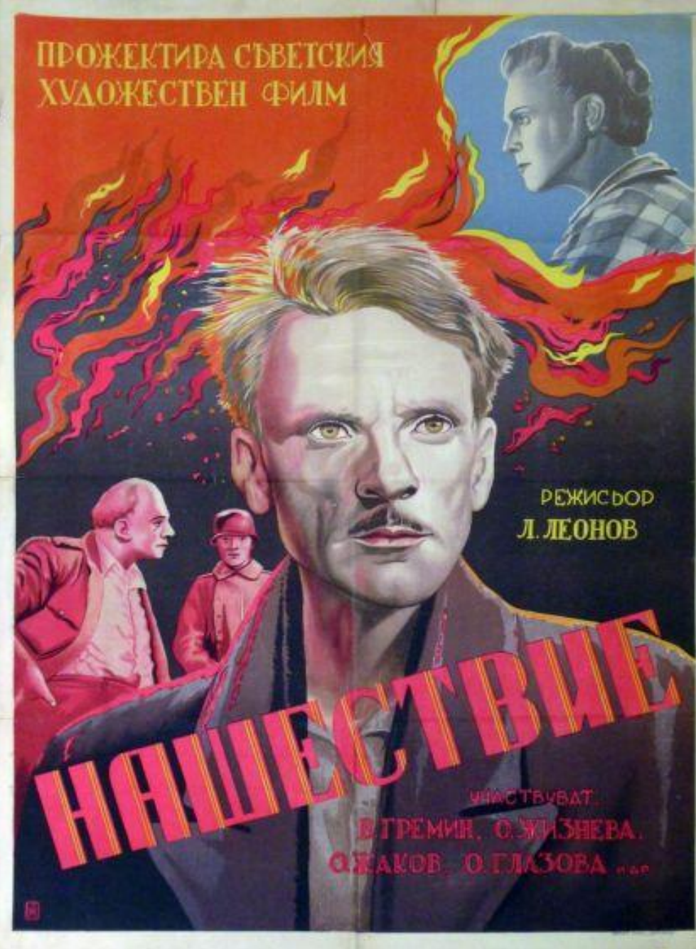
«Нашествие» 1944 г.