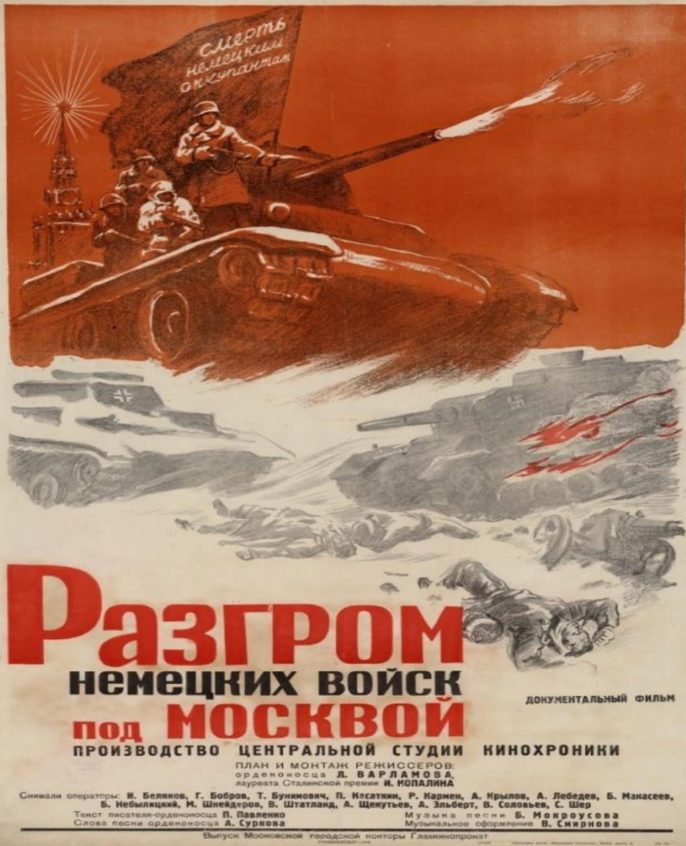
«Разгром немецких войск под Москвой» (1942)