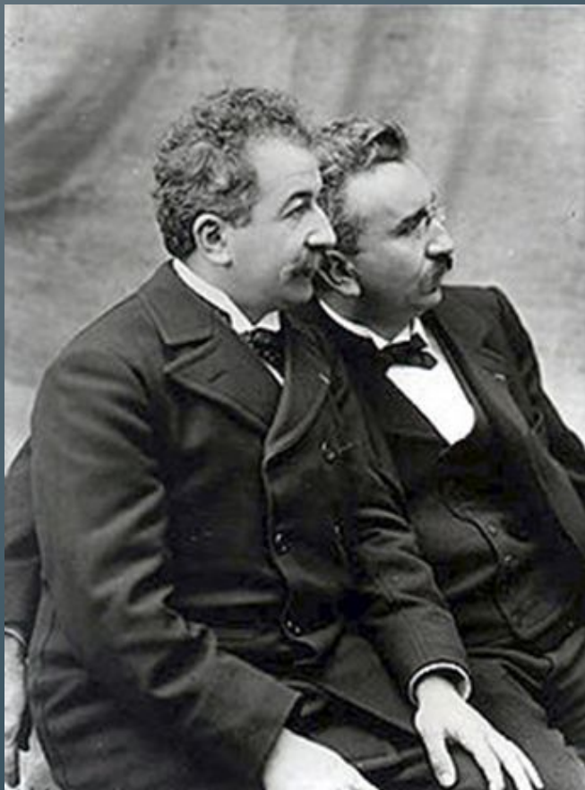
Братья Люмьер (Огюст слева, Луи справа)