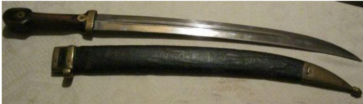
кривой кинжал – БЕБУТ