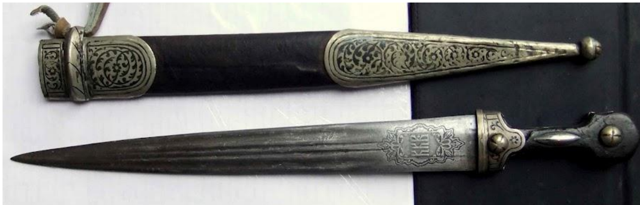
прямой кинжал - КАМА