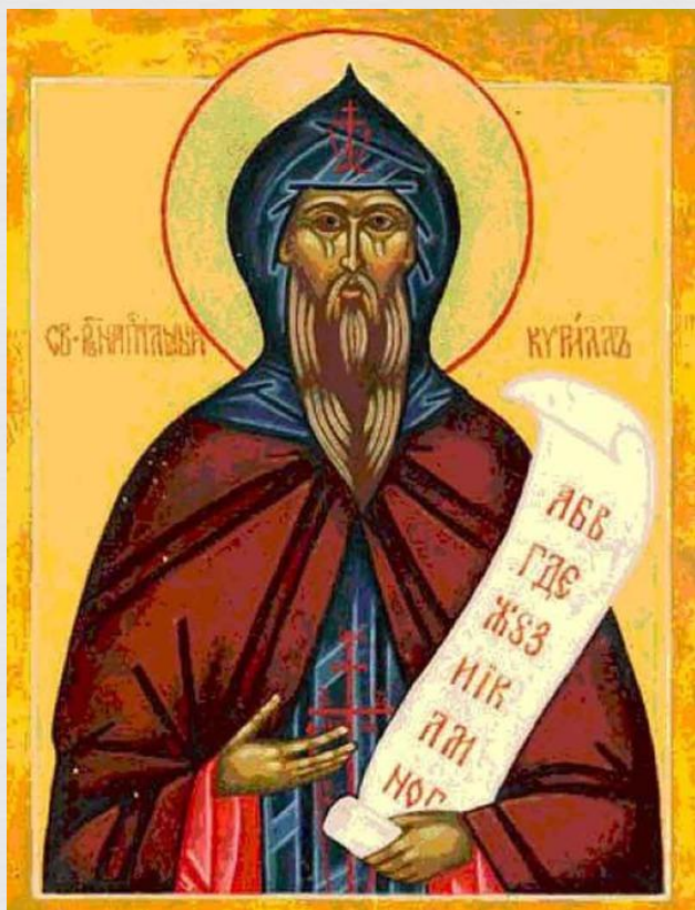
Святой равноапостольный Кирилл (827 - 869), по прозвищу Философ, учитель Словенский.

Константин с младенчества обнаружил необычайные умственные способности. Слух о его даровитости достиг Константинополя, и тогда он был взят ко двору, где учился вместе с сыном императора у лучших учителей столицы Византии, где одним из них был Фотий, будущий патриарх Константинопольский. Константин быстро изучил грамматику, арифметику, геометрию, астрономию, музыку, знал 22 языка.