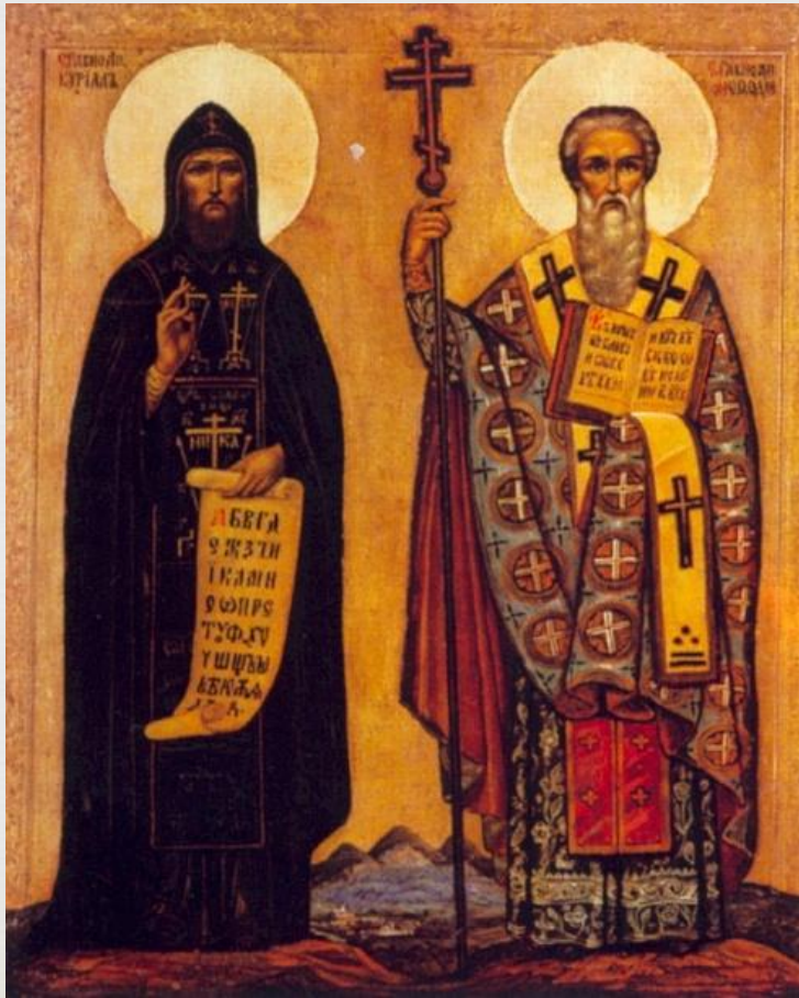
Кирилл и Мефодий

Кирилл и Мефодий — славянские первоучители, великие проповедники христианства, создатели славянской азбуки, первые переводчики богослужбных книг с греческого на славянский язык.