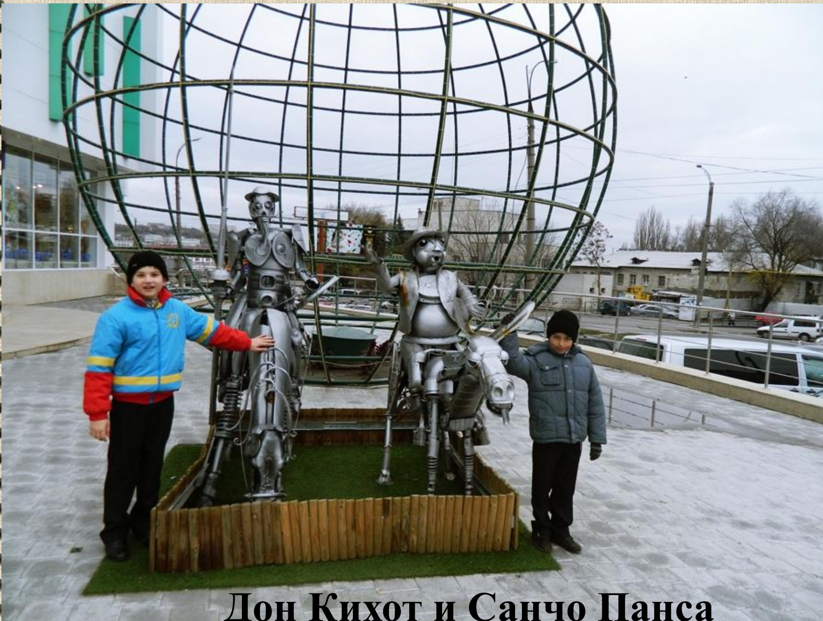
Дон Кихот и Санчо Панса