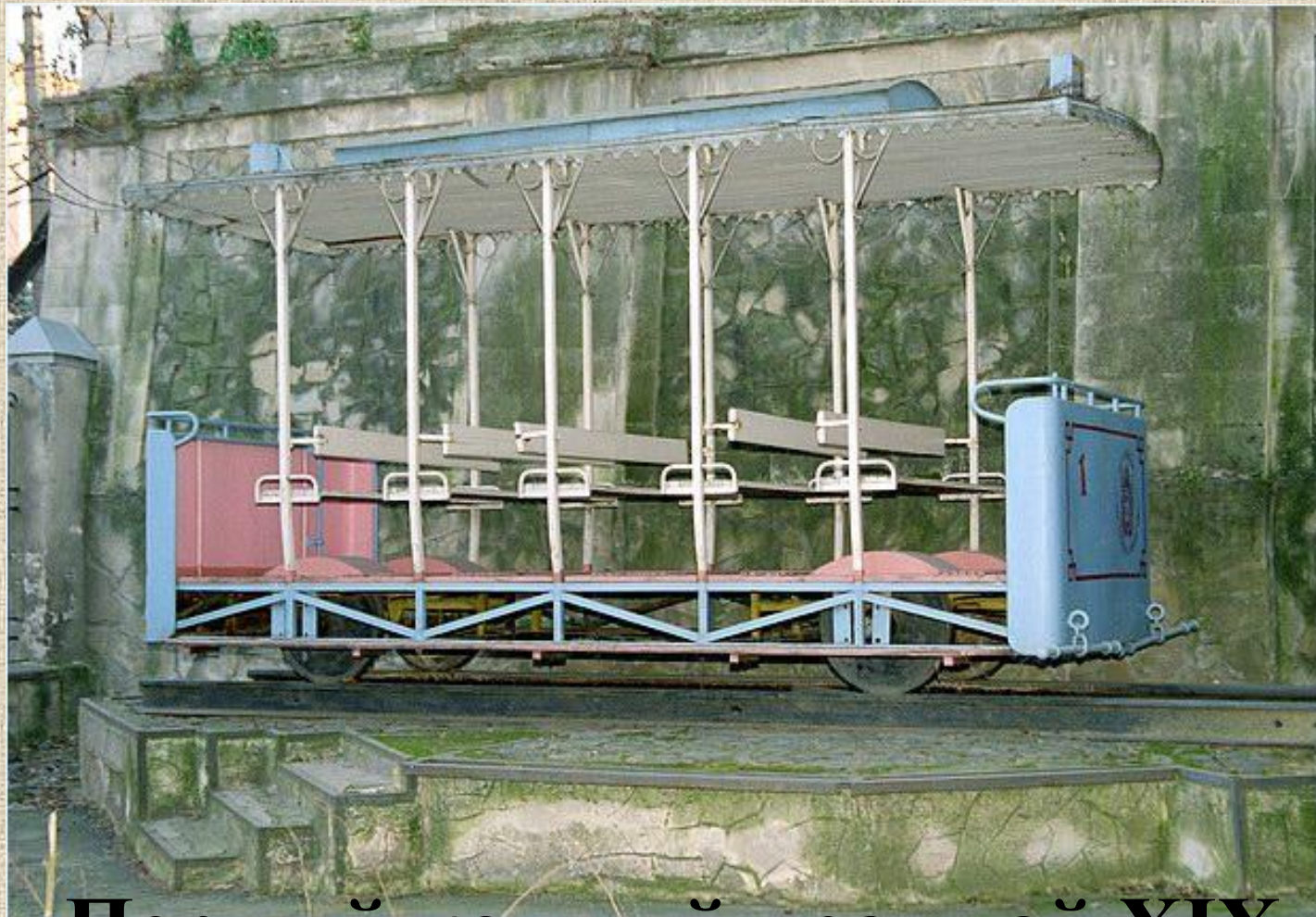
Первый конный трамвай XIX века Паровоз 1950 года