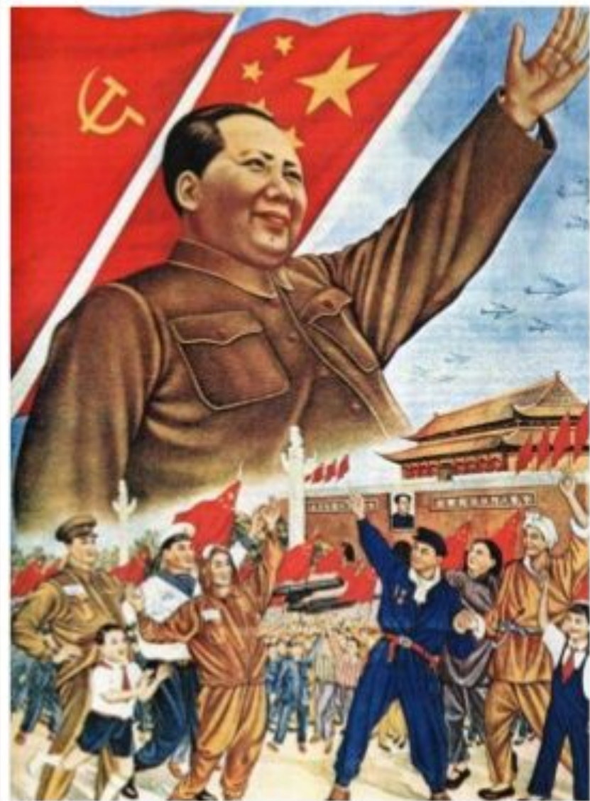
Мао Цзэдун. Плакат

В конце сентября 1949 г. в Пекине состоялось заседание Народного политического консультативного совета, включавшего представителей КПК и других антигоминьдановских политических сил. На заседании было принято решение о создании Центрального народного правительственного совета (ЦНПС) во главе с председателем КПК Мао Цзэдуном. Исполнительная власть передавалась новому китайскому правительству. Главной целью коммунистов стало превращение Китая в «сильную промышленно развитую державу с руководящей ролью рабочего класса и строительство в перспективе социалистического общества».