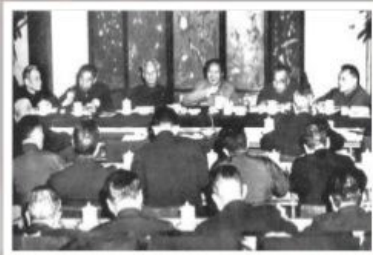
Январский (1961 г.) пленум ЦК КПК

Результаты осуществления «курса на регулирование экономики»