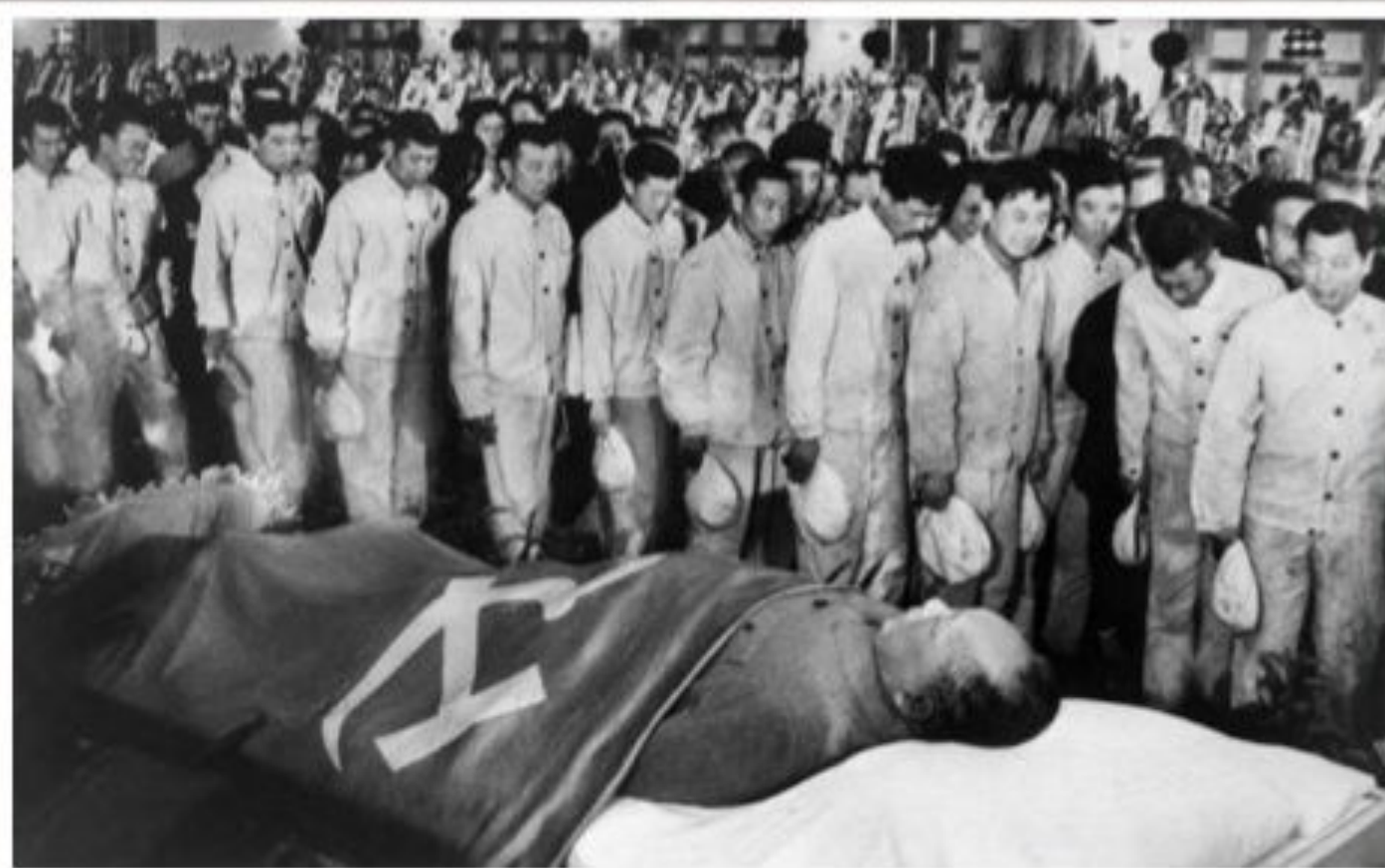
Похороны Мао Цзэдуна

9 сентября 1976 г. 82-летний Мао Цзэдун умер, оставив после себя огромную страну, изолированную от всего мира, неэффективной экономикой.