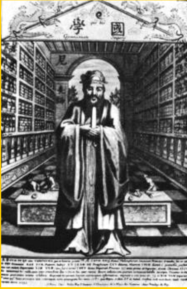
Конфуций-покровитель просвещения. Европейская гравюра 17 в.

Накопительство не поощряется. Главное-справедливость и человеколюбие.