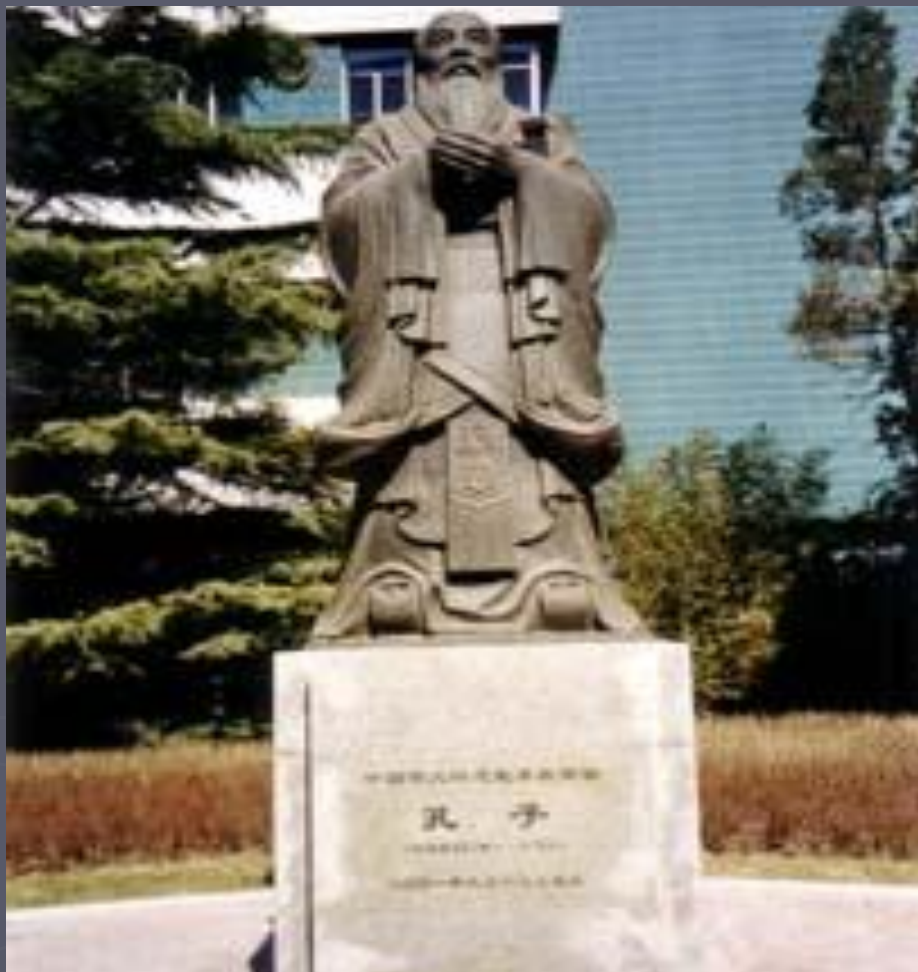
Памятник Конфуцию. Пекинский университет.