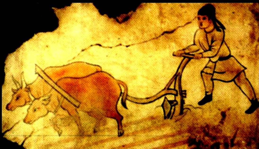
СЛЕДЯ ЗА РАБОТОЙ И, ВИДЕВ ОТРАЖАЮЩИ СВОИ ОТРАЖАЮЩИ