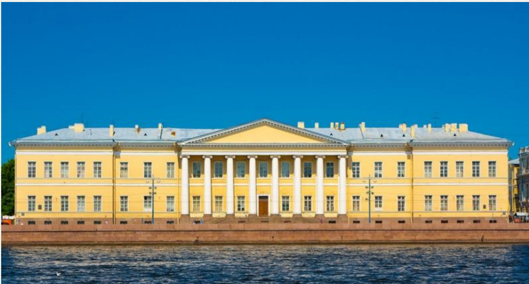
Здание Академии наук Архитектор: Джакомо Кваренги