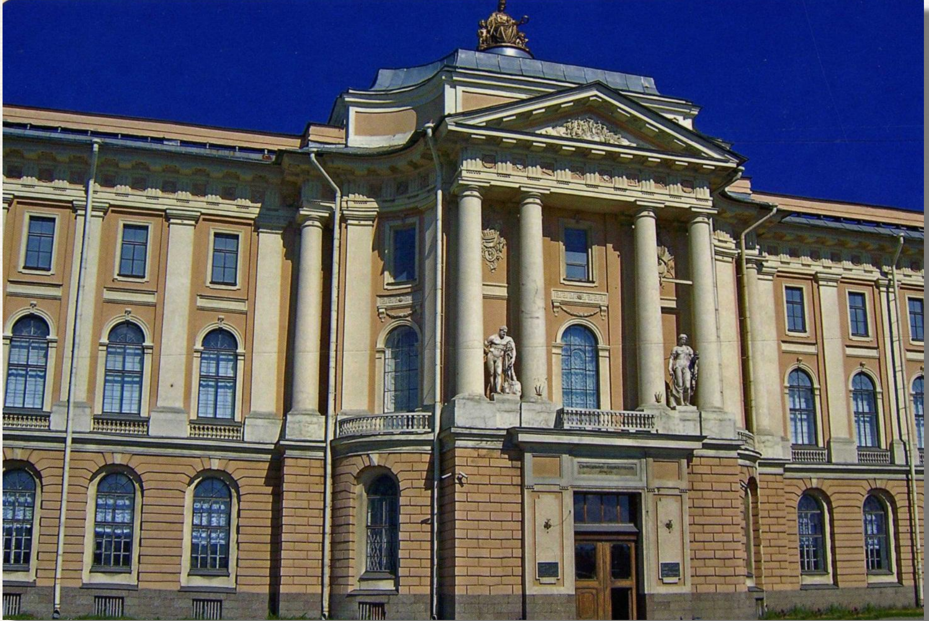
Здание Академии художеств Архитектор: Жан Батист Валлен-Деламот