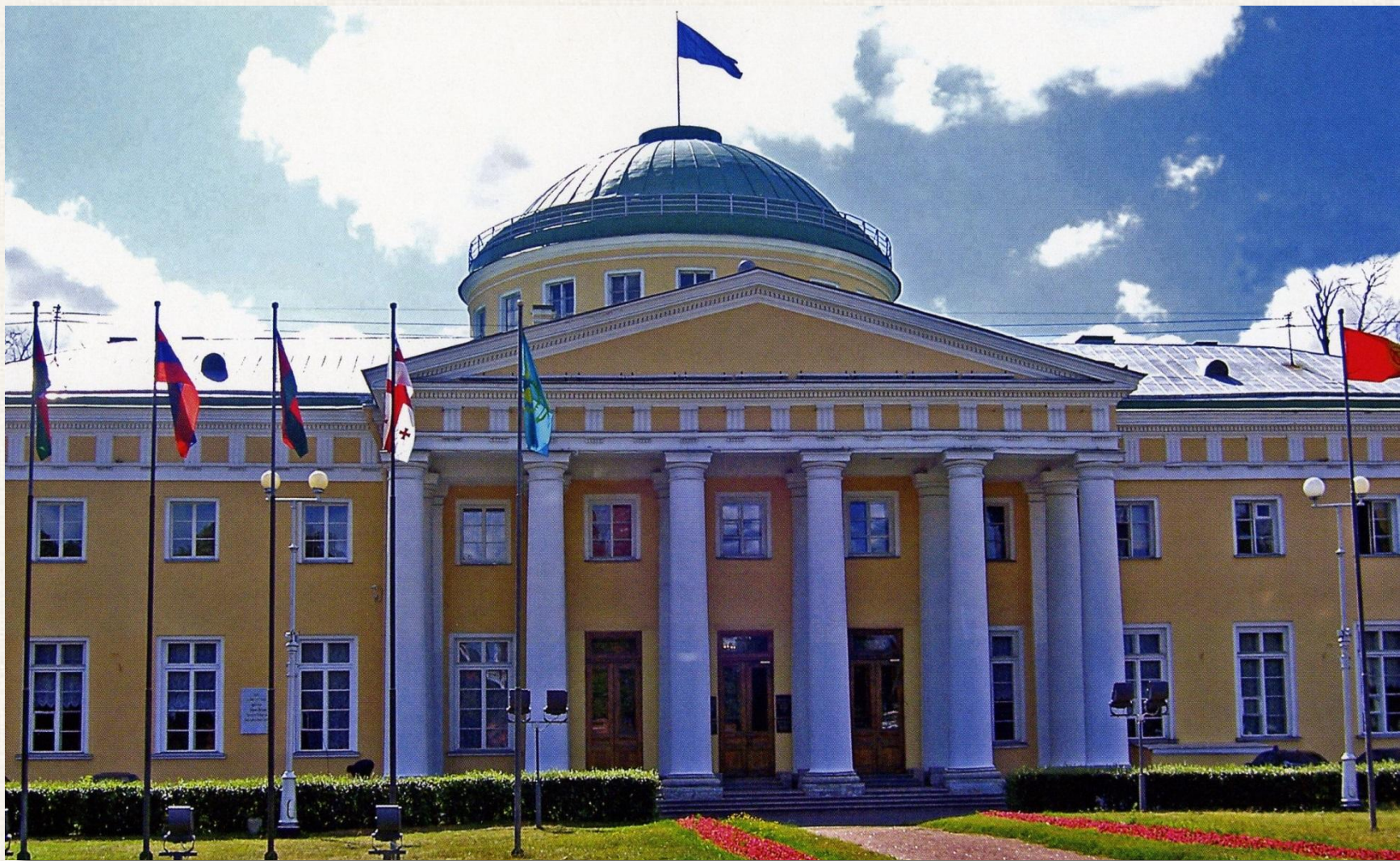
Таврический дворец Архитектор: Иван Егорович Старов