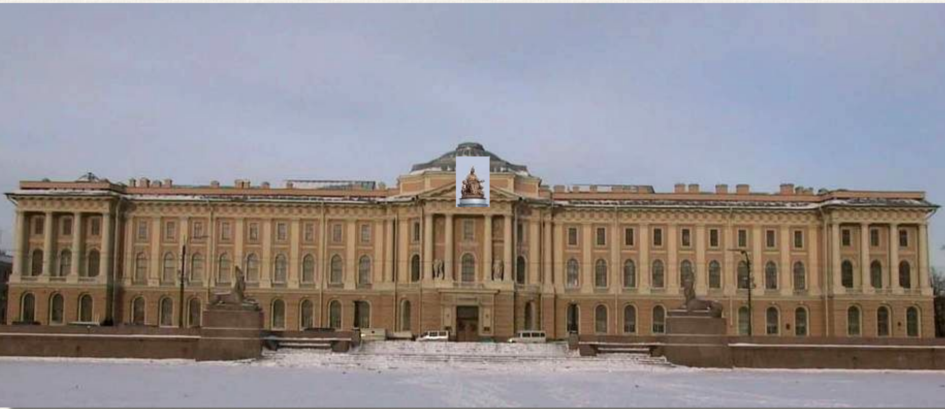
Здание Академии художеств Архитектор: Жан Батист Валлен-Деламот