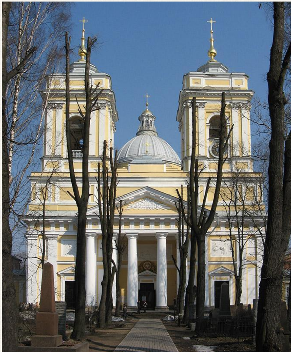
Троицкий собор Александро-Невской лавры Архитектор: Иван Егорович Старов