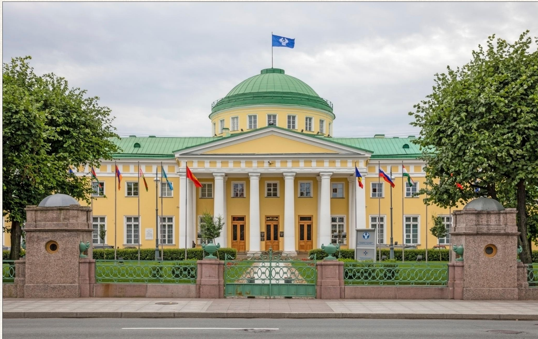
Таврический дворец Архитектор: Иван Егорович Старов