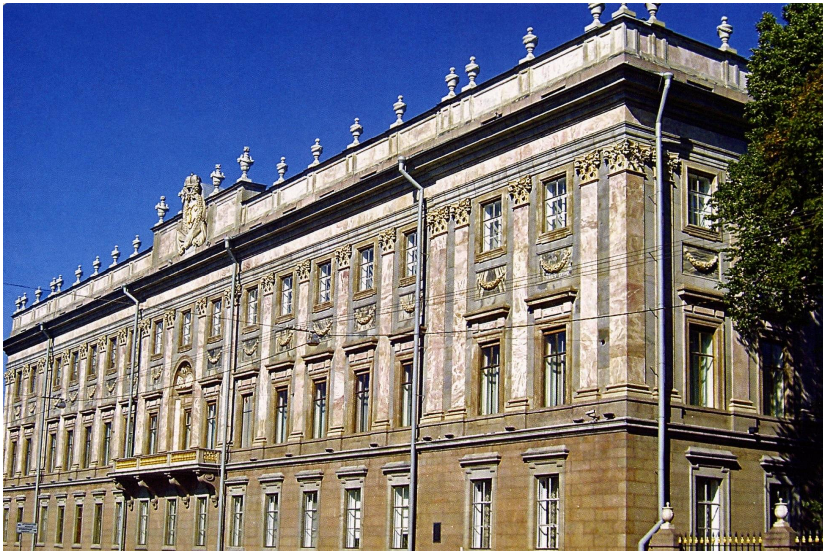
Мраморный музей Архитектор: Антонио Ринальди