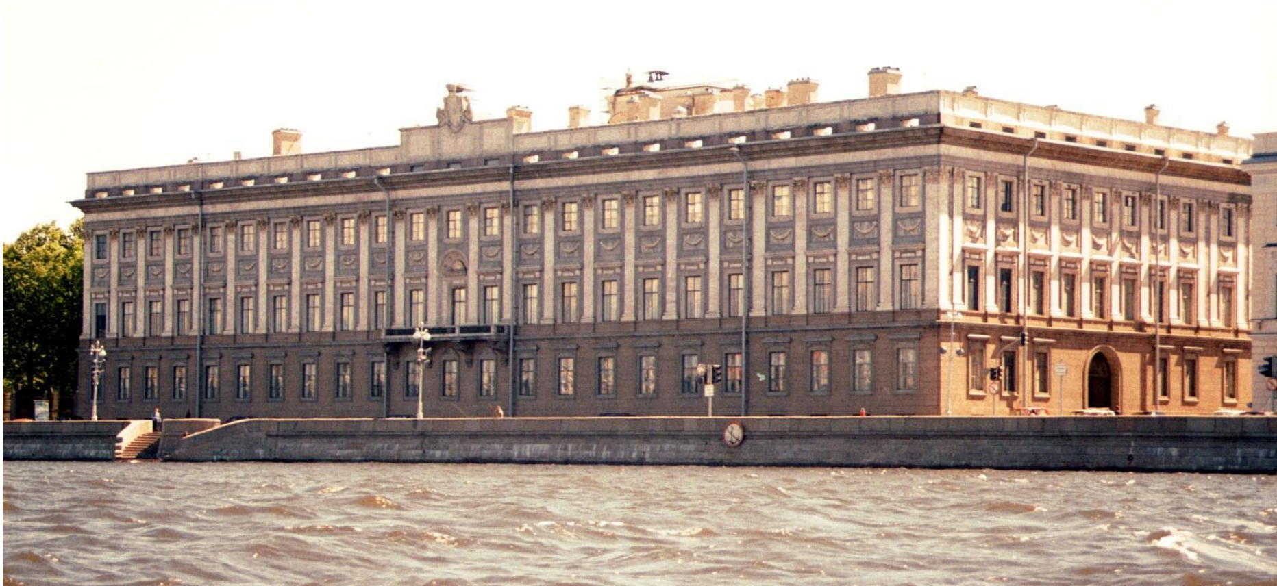
Мраморный музей Архитектор: Антонио Ринальди