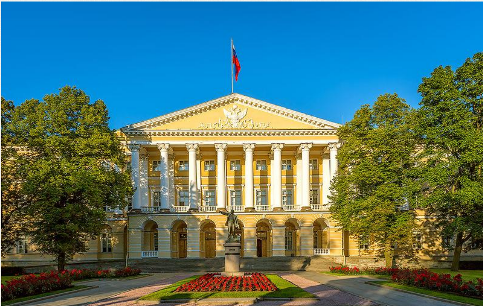
Здание Смольного института Архитектор: Джакомо Кваренги