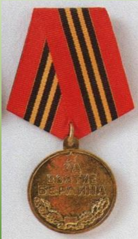
Медаль «За взятие Берлина»