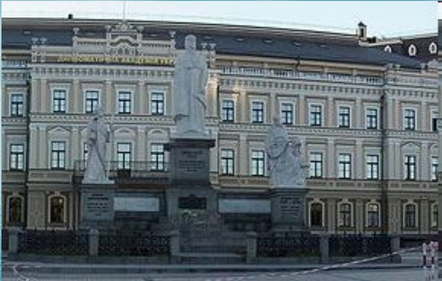
Памятник княгине Ольге, Св. Апостолу Андрею Первозванному и равноапостольным Кириллу и Мефодию в Киеве.