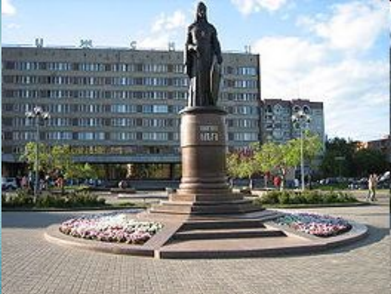
Памятник княгине Ольге в Пскове. Работа З. Церетели, 2003 г.