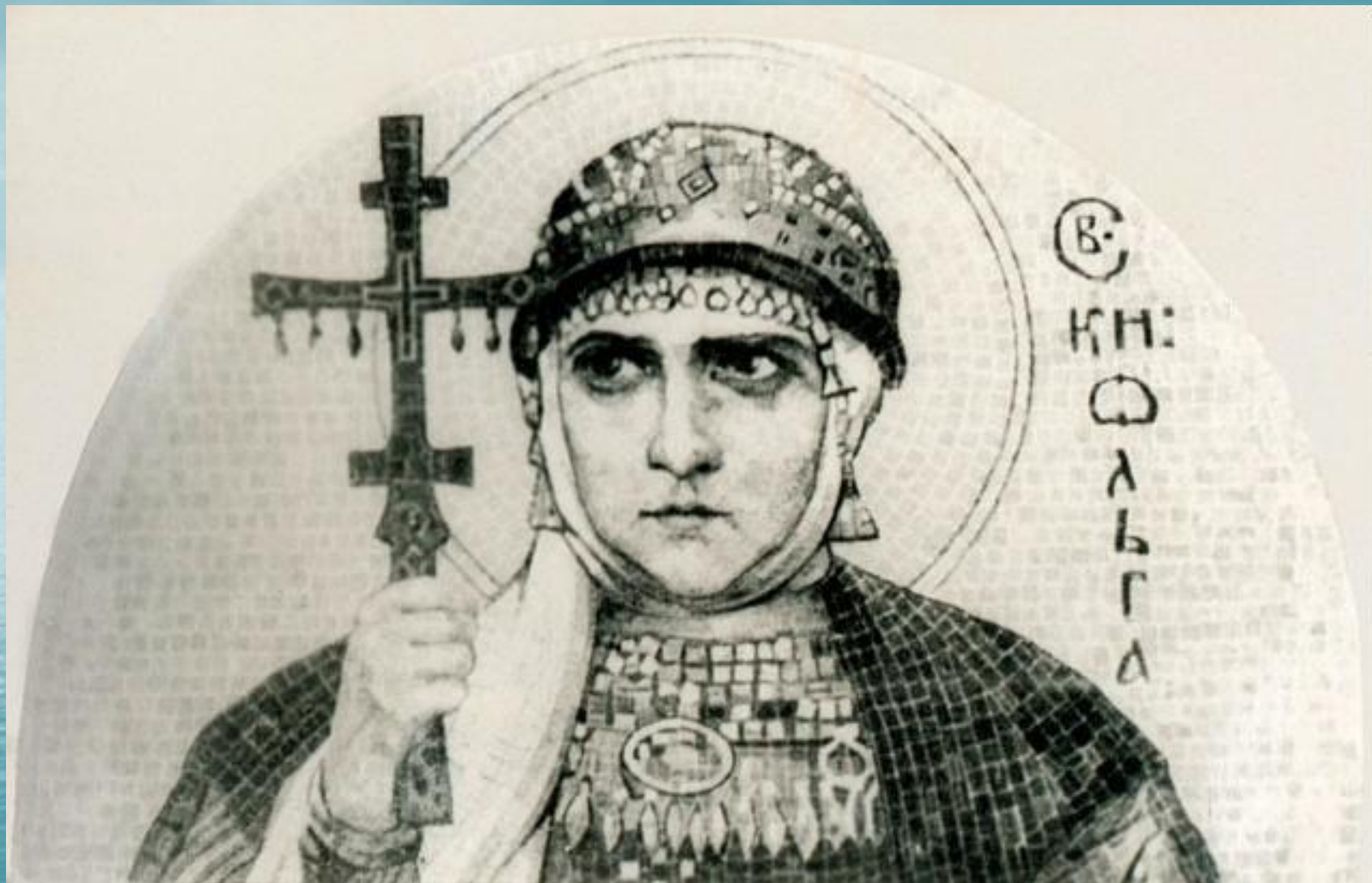
«Святая Ольга». Эскиз к мозаике Н. К. Рериха . 1915