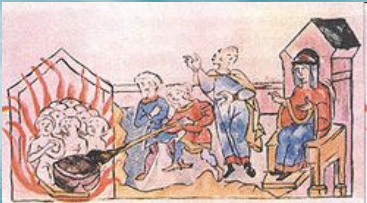
Вторая месть Ольги древлянам. Миниатюра из Радзивилловской летописи.