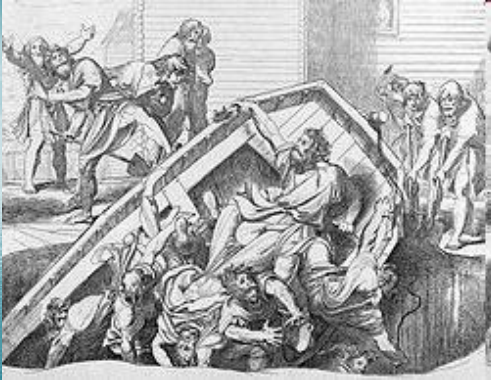
«Мщение Ольги против идолов древлянских». Гравюра Ф. А. Бруни , 1839.