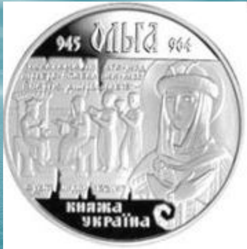
Княгиня Ольга на современной украинской монете