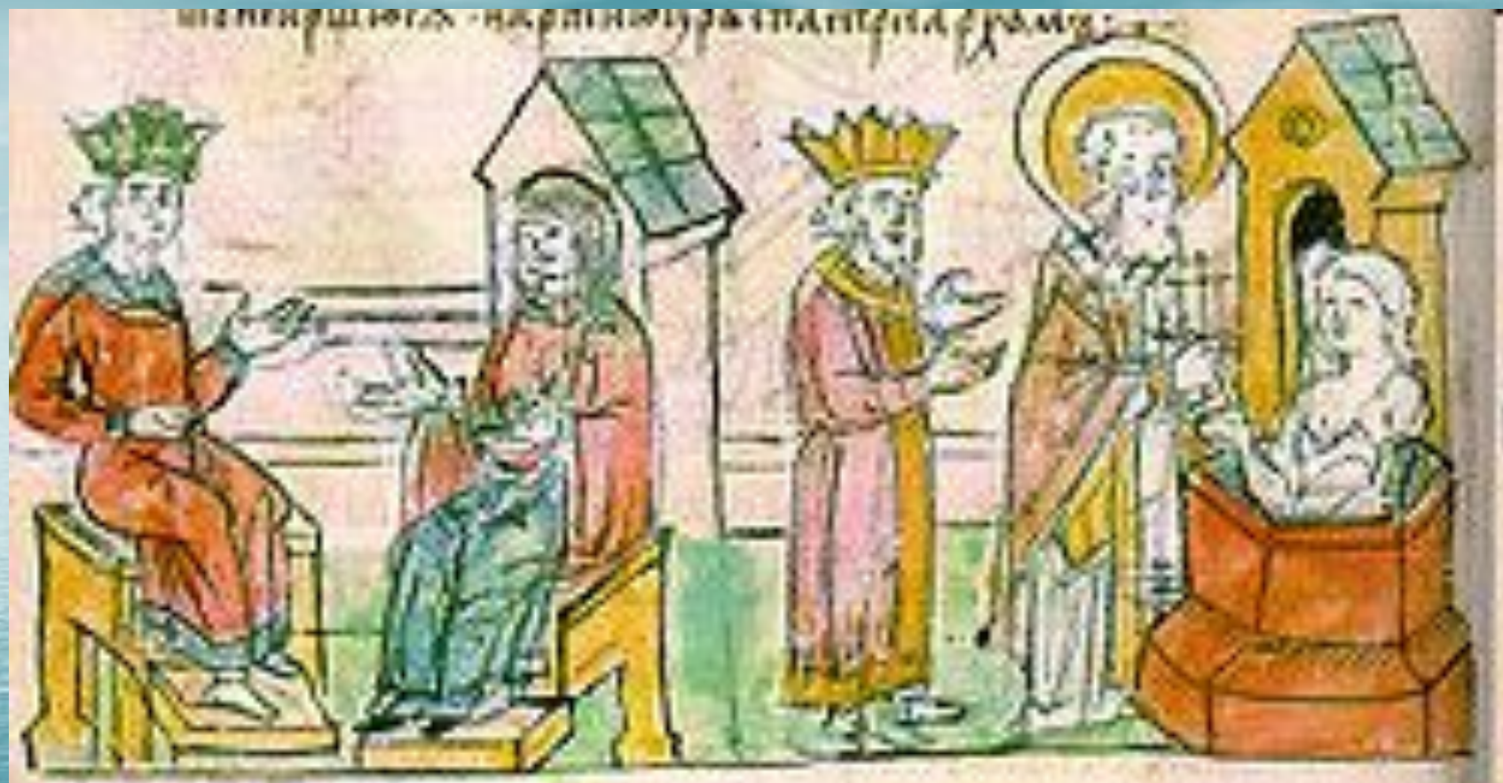
Крещение Ольги в Царьграде. Миниатюра из Радзивилловской летописи .