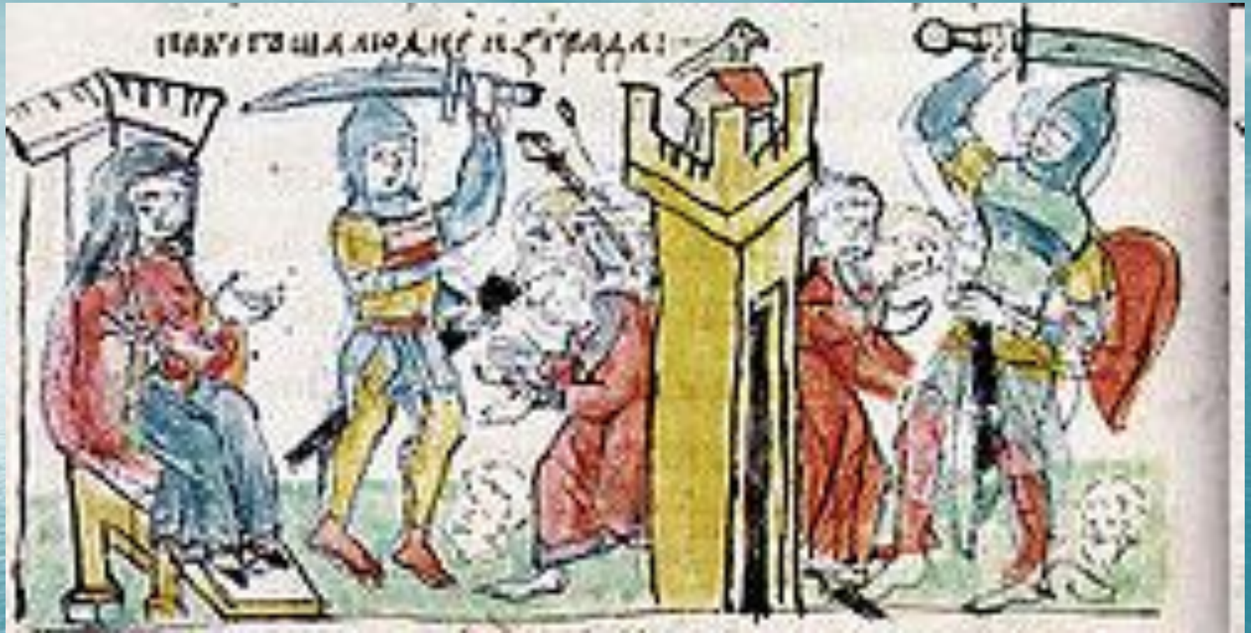
Четвёртая месть Ольги древлянам. Миниатюра из Радзивилловской летописи