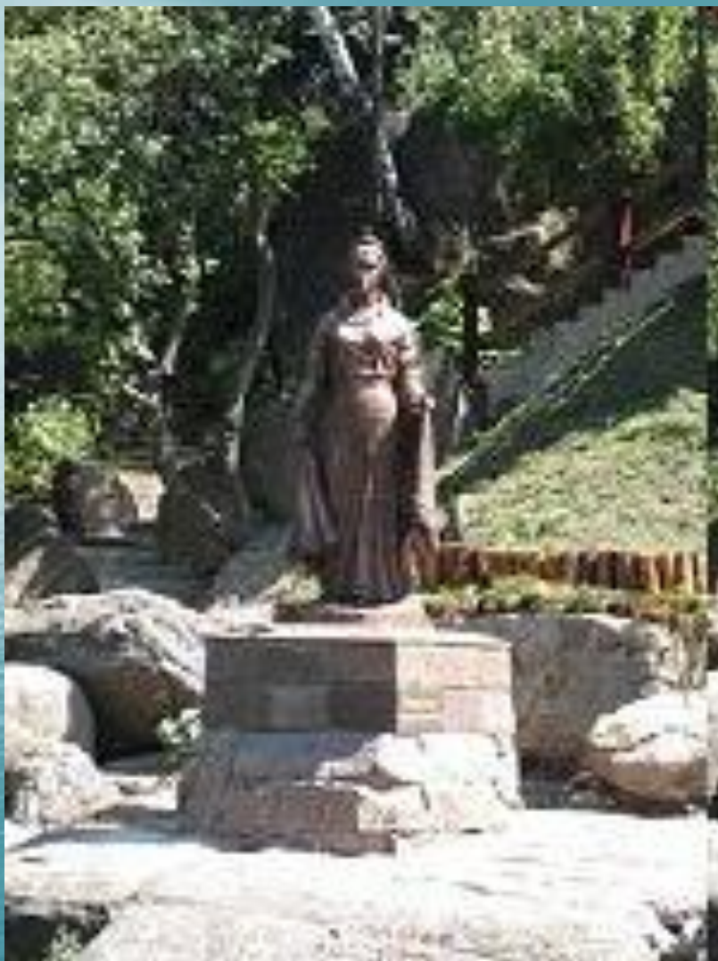
Памятник княгине Ольге, в городе Коростень. 2008 г.