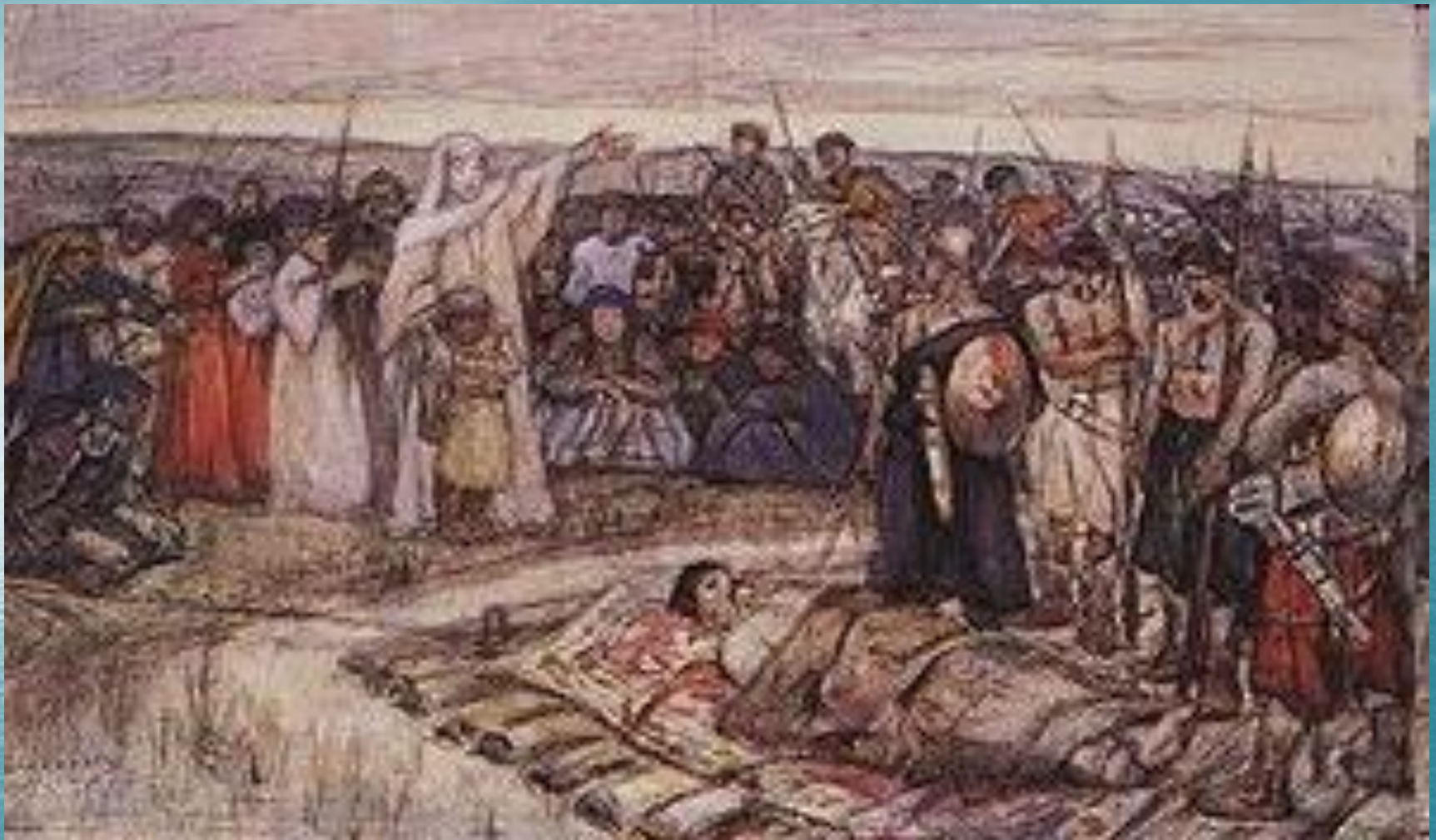
«Княгиня Ольга встречает тело князя Игоря». Эскиз В. И. Сурикова , 1915