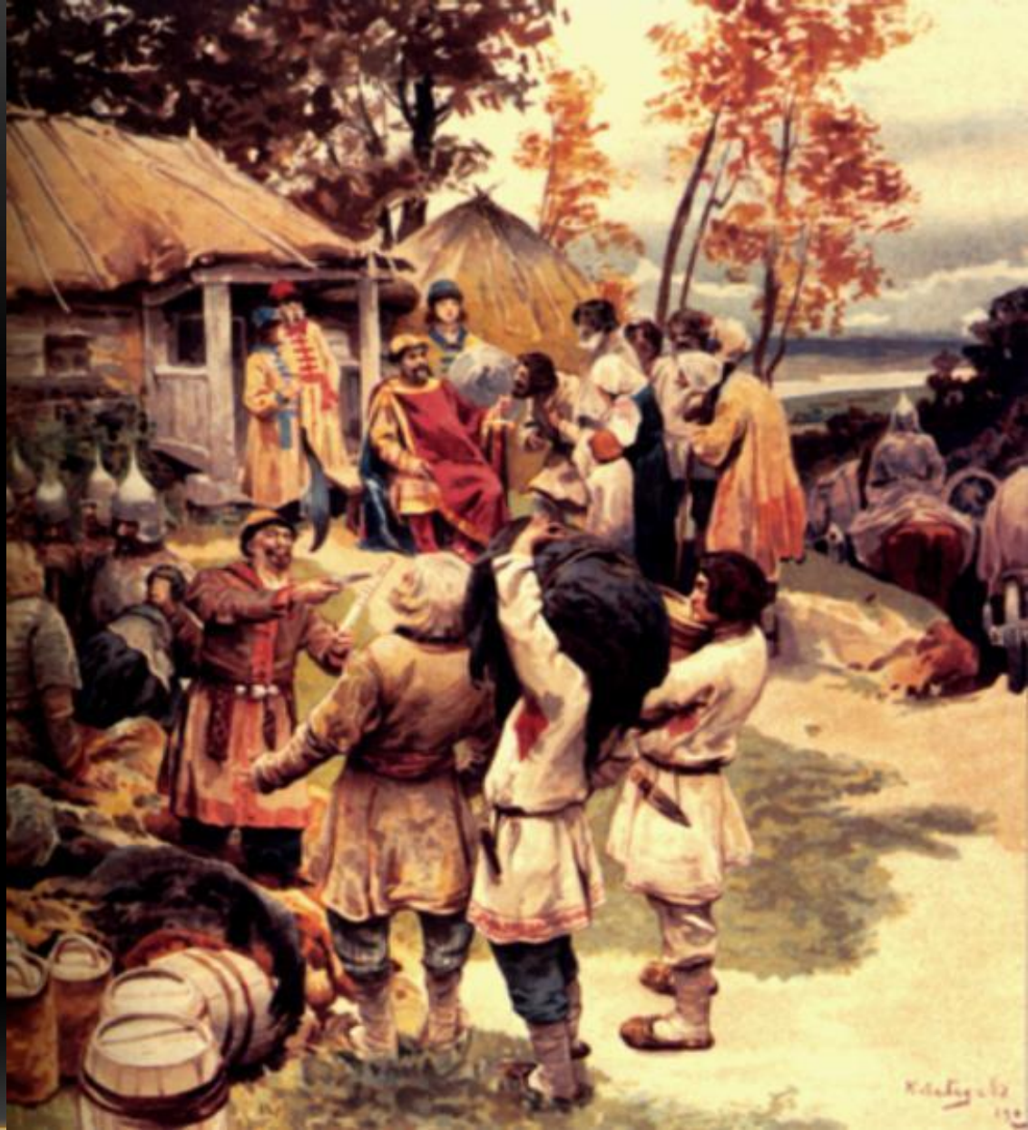
Сбор дани на Руси - полюдье