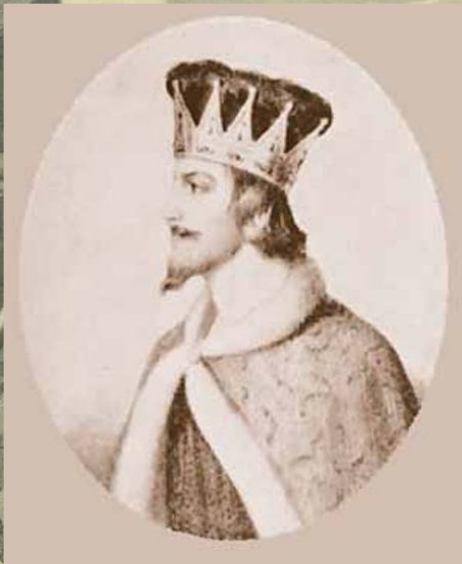
Князь Святополк Окаянный