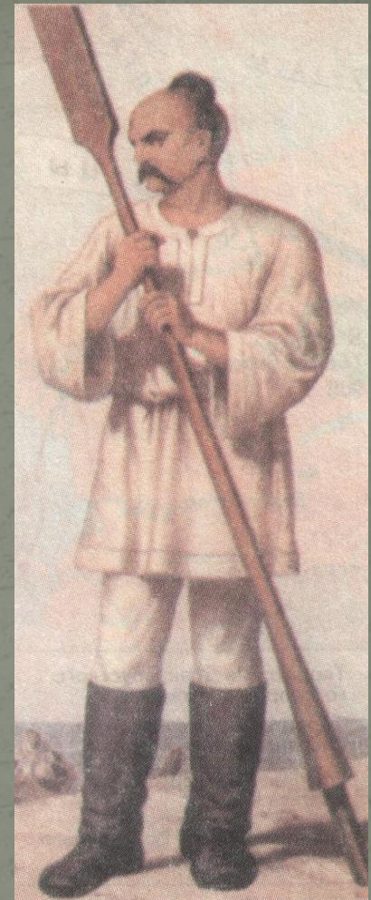
Князь Святослав Рисунок XIX в.