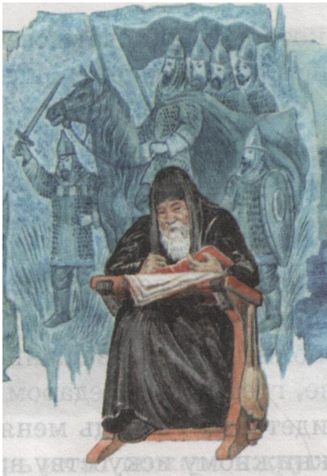
Нестор – летописец, автор «Повести временных лет»

Основными источниками сведений о жизни Святослава являются «История» Льва Дьякона и «Повесть временных лет» .