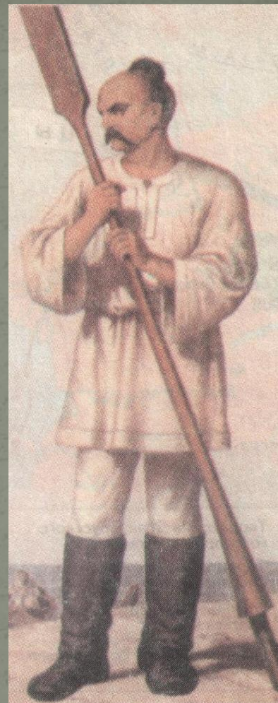
Князь Святослав Рисунок XIX в.