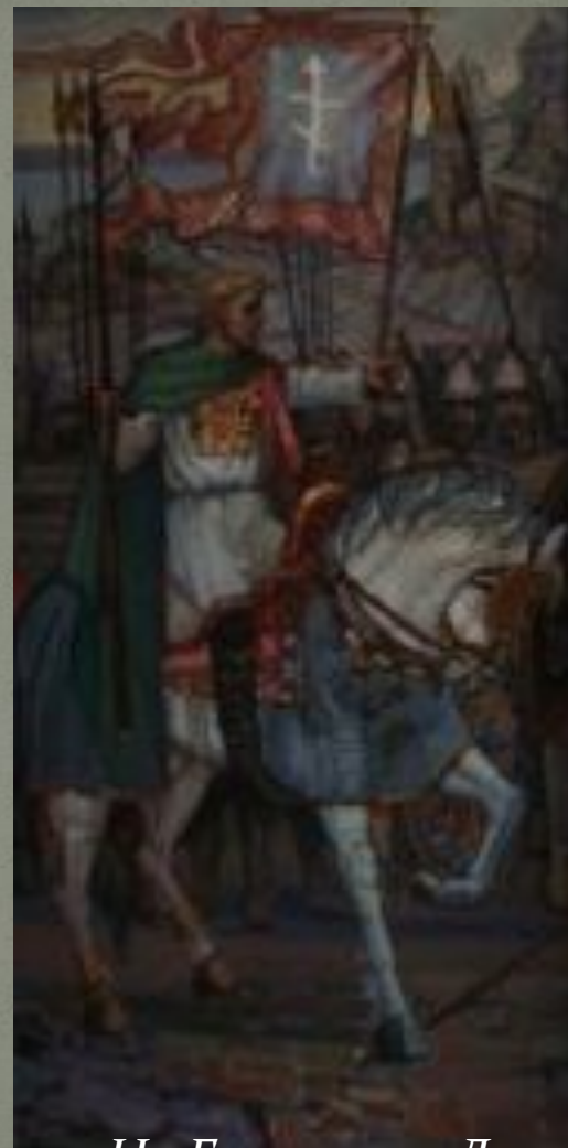
Боляков Н. Битва при Доростоле (триптих). Цимисхий

Византийцы имели численное и техническое превосходство, но не смогли разбить противника и взять Доростол. Силы Святослава были на исходе, поэтому почетный мир вполне его устраивал.