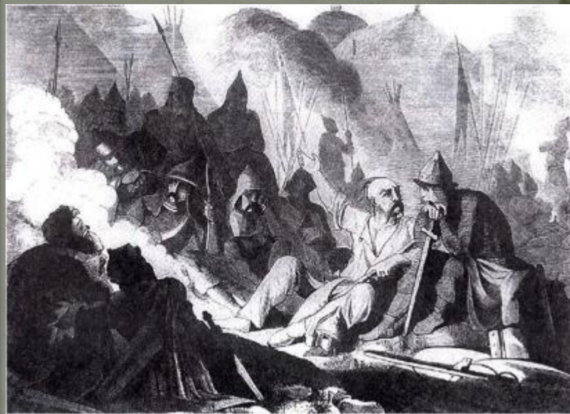
Б. А. Чориков. Военный совет Святослава.

С тяжелыми боями, отбиваясь от наседающего врага, отходили русские к Дунаю. Там, в городе Доростоле, последней русской крепости в Болгарии, отрезанное от родной земли, войско Святослава оказалось в осаде.