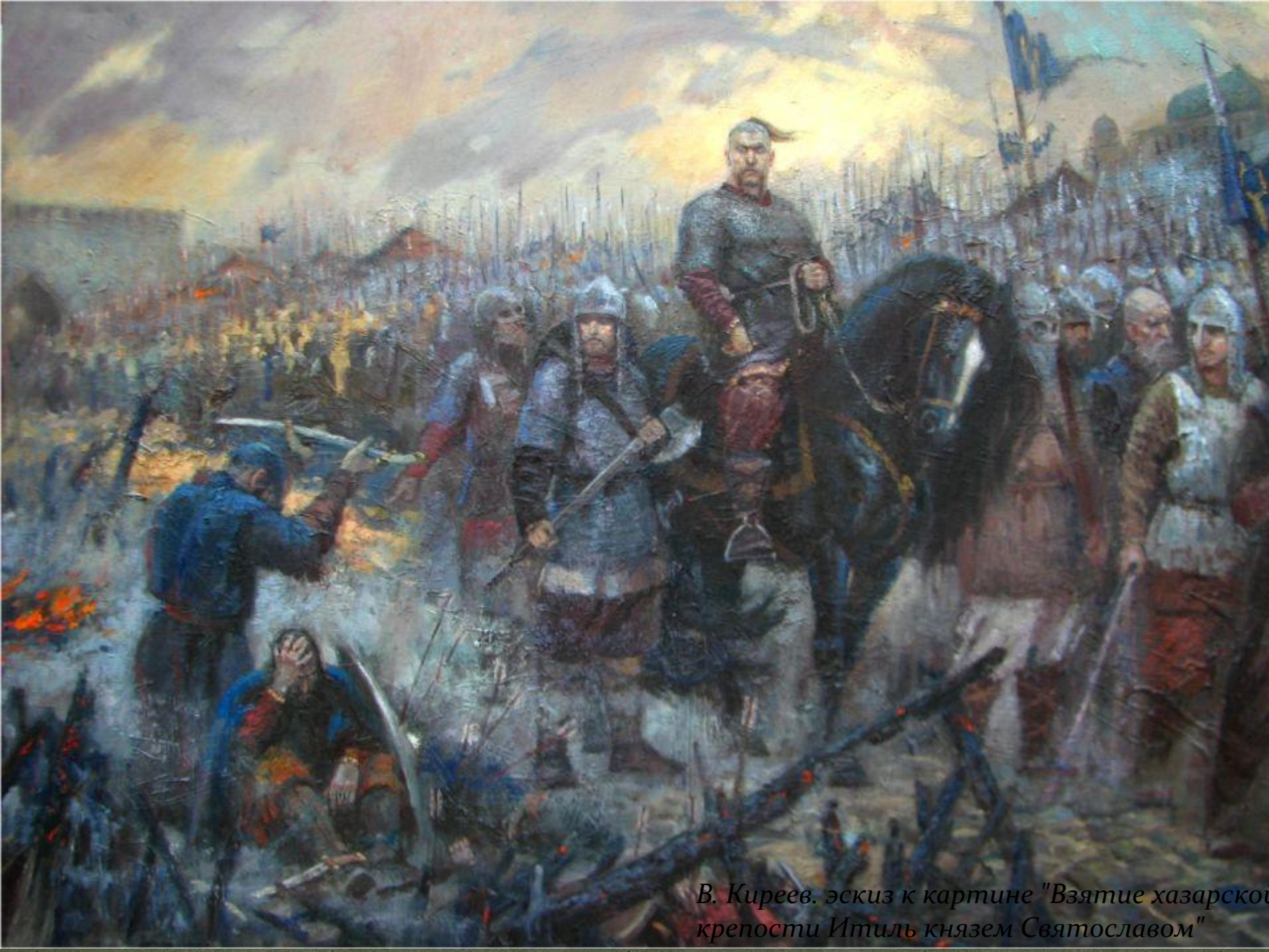
В. Киреев. эскиз к картине "Взятие хазарской крепости Итиль князем Святославом"