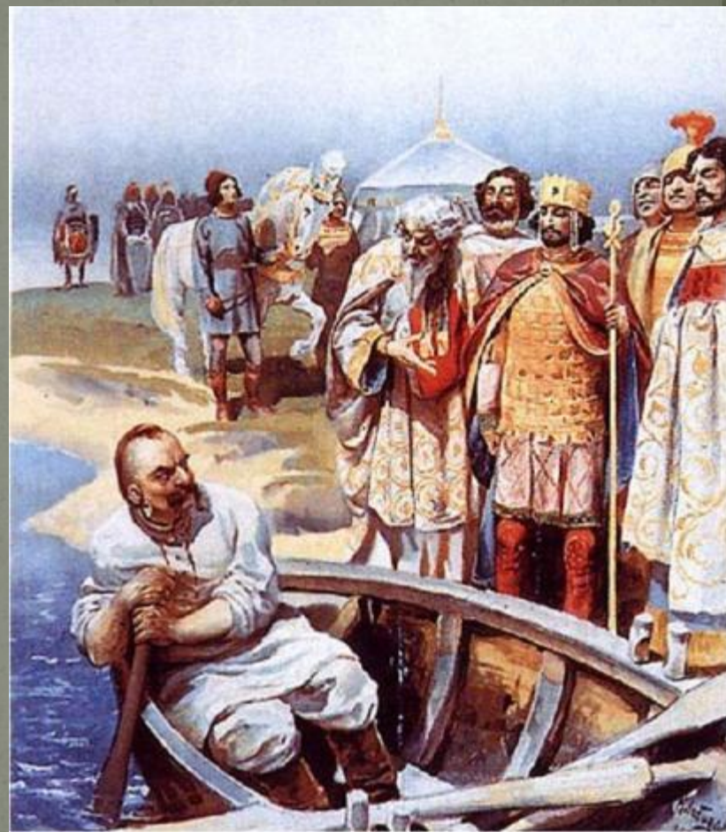
К. Лебедев. Встреча Святослава с Иоанном Цимисхием

После заключения мира состоялось свидание Святослава с Цимисхием.