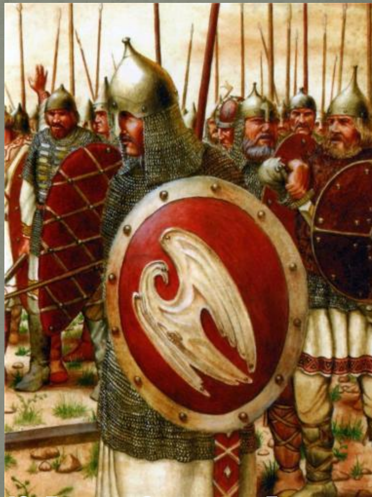
Ю. Лазарев. Завоевание Болгарского царства. 968—969 годы