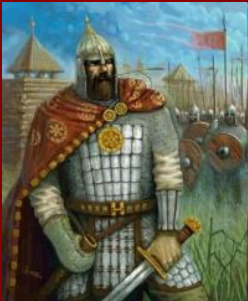
Князь Ярополк Святославич