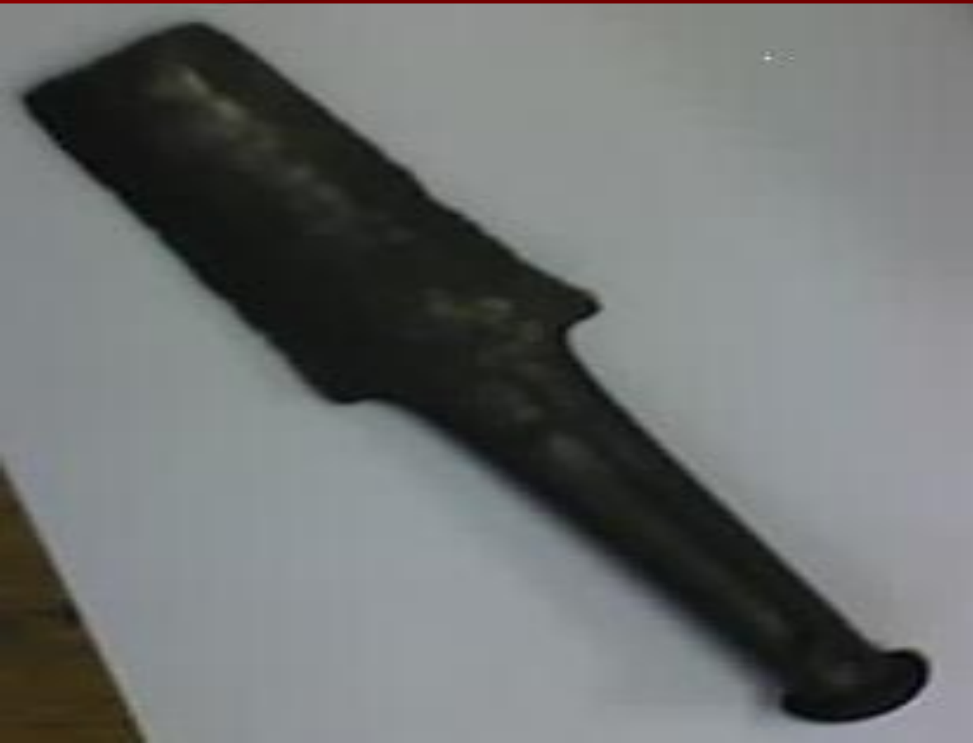
Фрагмент железного кинжала