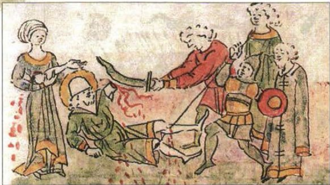
Убийство Андрея Боголюбского. Миниатюра из Радзивилловской летописи

29 июня, ещё до того, как князь отправился спать, ключник Анбал вынес из спальни хозяина его меч. Ночью убийцы перебили дворцовую стражу. Затем двое из них подня-