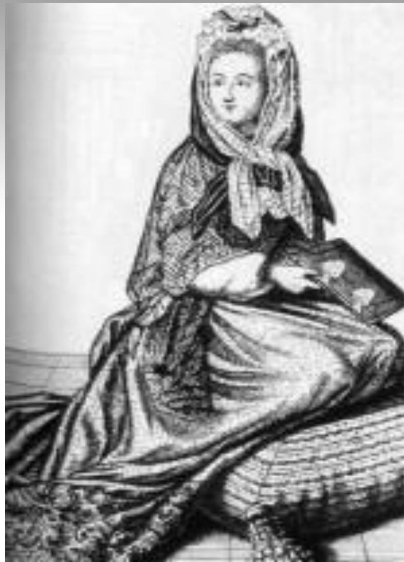
Нац. костюм Франции