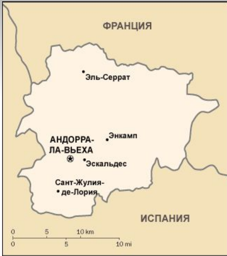
А). Карта Андорры.