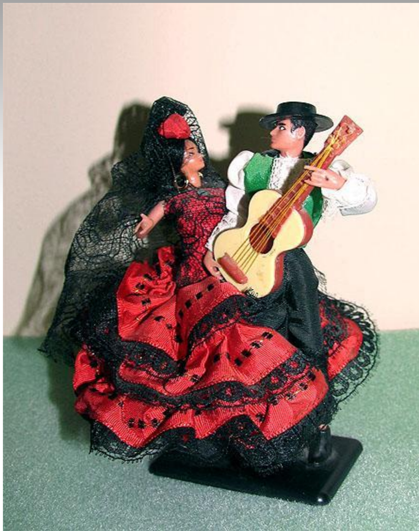
Нац. костюм Испании