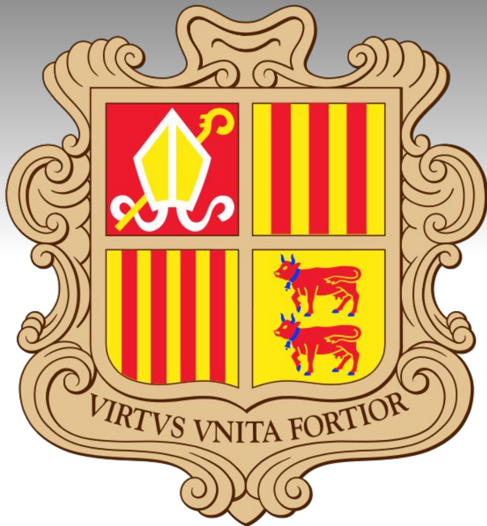
4). Герб Андорры.

Герб Андорры является государственным символом Андорры, современный герб был утверждён в 1969 году. Щит с изображением митры и посоха Урхельского епископа и двух быков символизируют совместное управление Франции и Испании; красные полосы на жёлтом фоне — цвета Каталонии и Беарна. Девиз на щите: «Вместе мы сильнее!» (лат. Virtus unita fortior ).