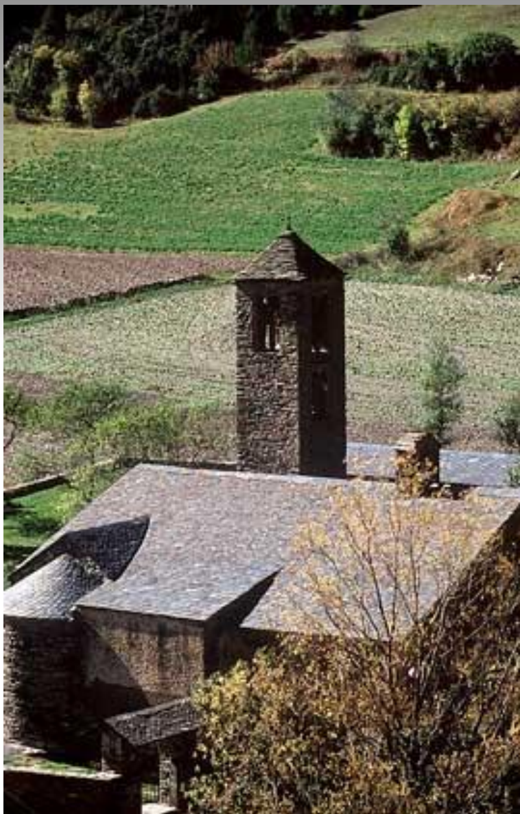
Деревня в Пиренеях.