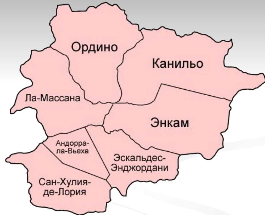
Б). Общины Андорры.