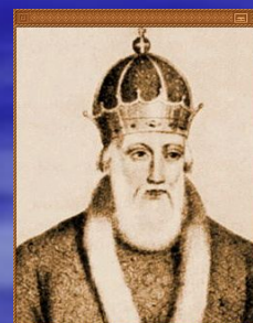
Владимир Красное Солнышко (Святой) (980-1054)