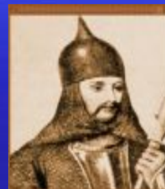
Олег Вещий (Киевская Русь) 912-945