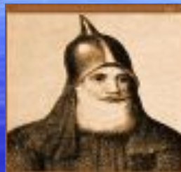
Рюрик (Новгород) 862-879