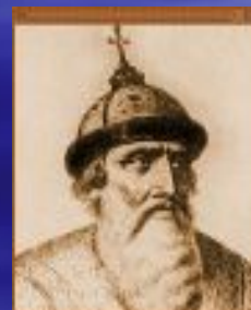
Владимир Мономах (1113-1125)