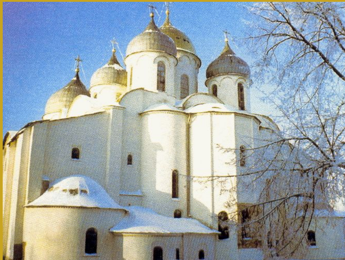
Храм Святой Софии в Новгороде.