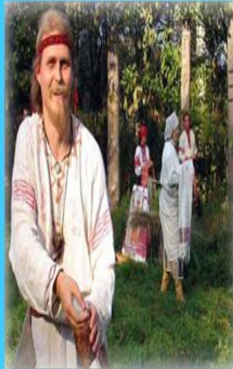
Внешний вид славян

Восточные славяне- племена, которые в древности жили на территории нашей Родины. От них произошли современные народы – русские, белорусы