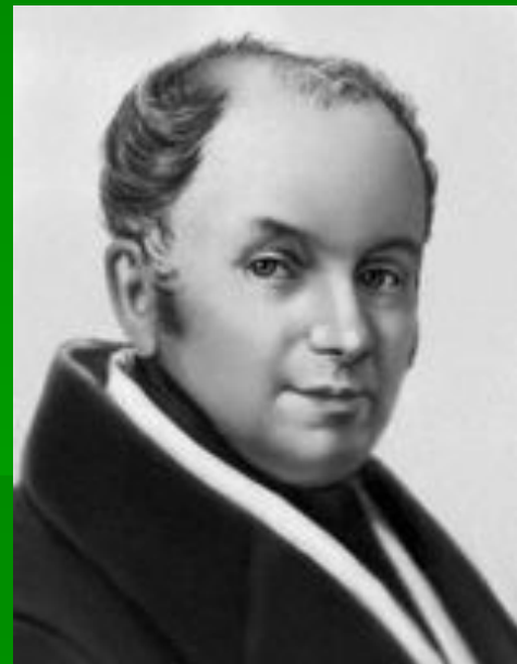
Василий Андреевич Жуковский