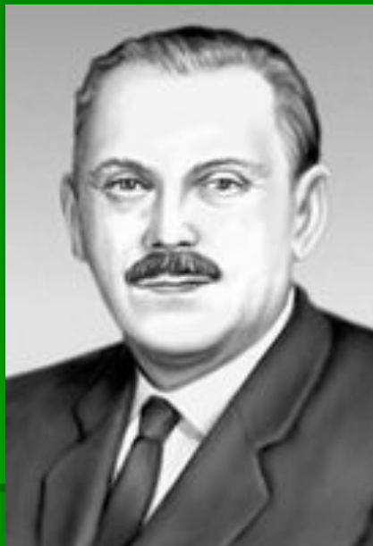
Сергей Владимирович Михалков

Назовите автора слов гимна Российской Федерации, утвержденного в 2001 году?