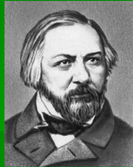
Михаил Иванович Глинка