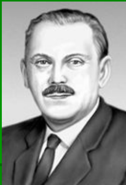
Сергей Владимирович Михалков

Назовите автора слов гимна Российской Федерации, утвержденного в 2001 году?