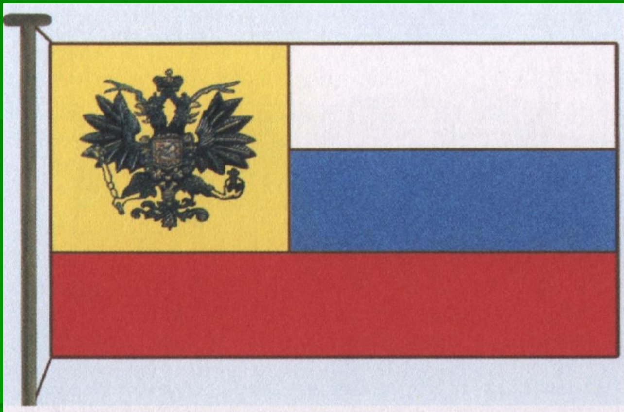
Флаг 1914 года