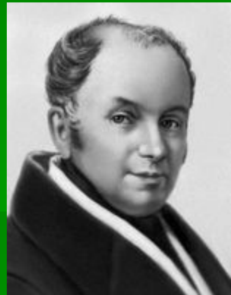
Василий Андреевич Жуковский