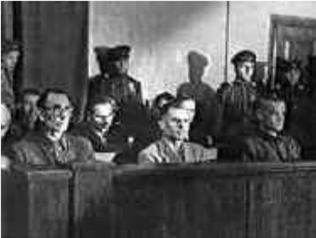
Власов на скамье подсудимых

12 мая 1945 года Власов был взят в плен советскими солдатами.