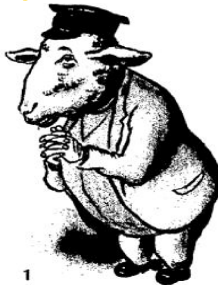
1. Кулак просится в колхоз

Карикатура 1931 г. Кулак просится в колхоз. Кулак в колхозе.