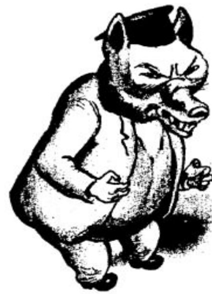
2. Кулак в колхозе

Ликвидация кулачества имела своей целью обеспечение колхозов материальной базой. В 1-й половине 1930 г. Было раскулачено 320 тыс крестьянских хозяйств. Их имущество отошло к колхозам. Все кулаки делились на 3 категории-те кто боролся с Советской властью подлежали расстрелу, наиболее богатые выселялись в отдаленные территории СССР, а остальные расселялись на участках за пределами колхозных земель.