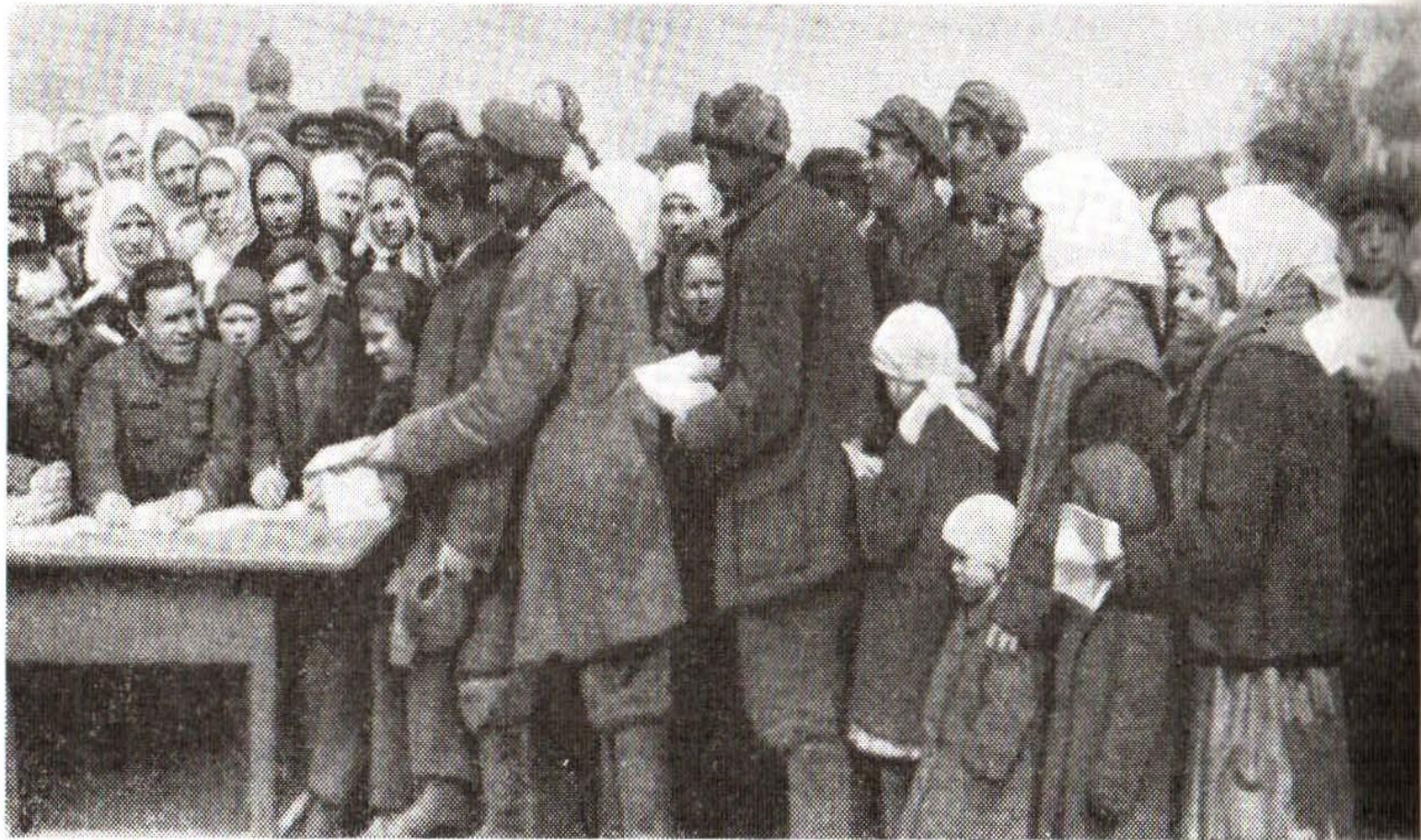
Подача крестьянами заявлений о принятии в колхоз. Борисоглебский район Центральной черноземной области. 1929 г. Фото