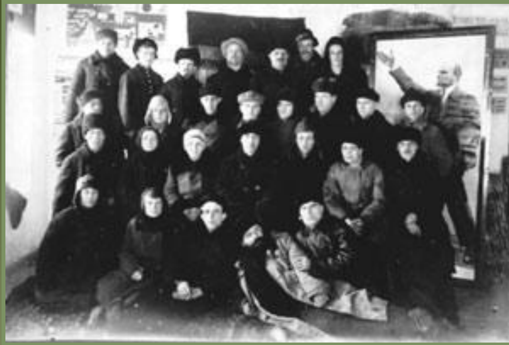
Двадцатипятитысячники из Ленинграда

Для оказания помощи местным властям в деревню было направлено 25 тыс. городских коммунистов («двадцатипятитысячники»)