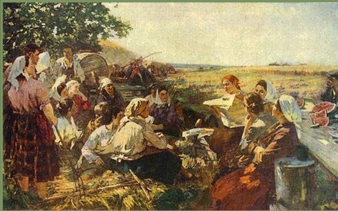
Е. Табакова. "В час отдыха".

7 ноября 1929 г. в «Правде» появилась статья Сталина «Год великого перелома» , где говорилось «о коренном переломе в развитии нашего земледелия от мелкого и отсталого индивидуального хозяйства к крупному и передовому коллективному земледелию».