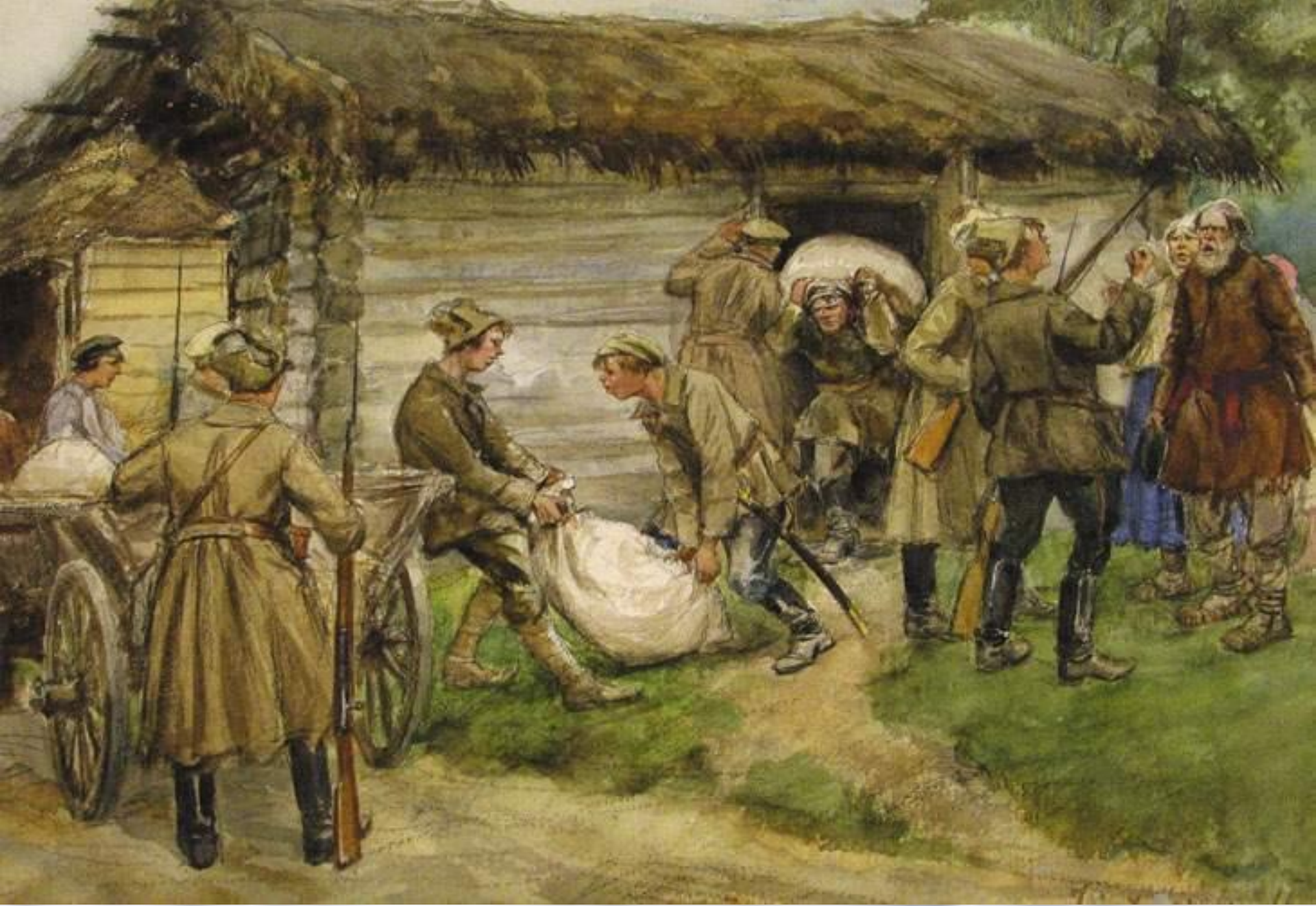
Семья «кулака» на выселение.