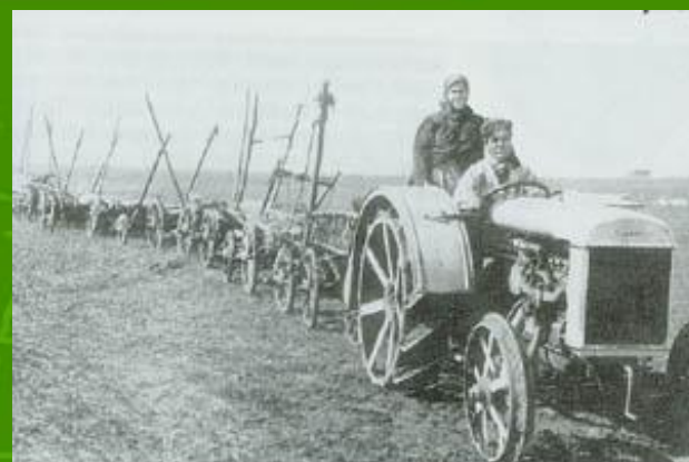
Новая техника на колхозных полях.