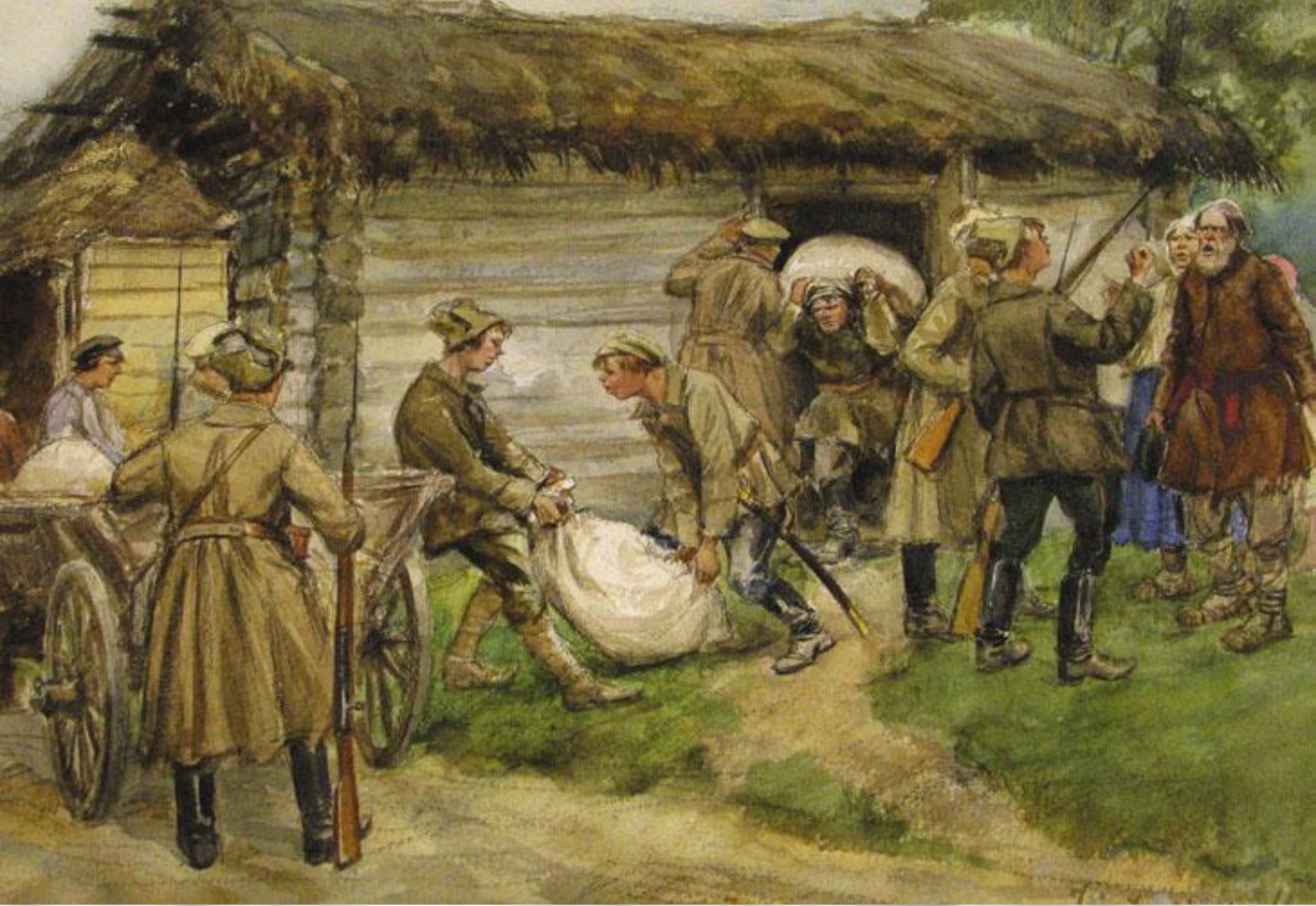
Семья «кулака» на выселение.