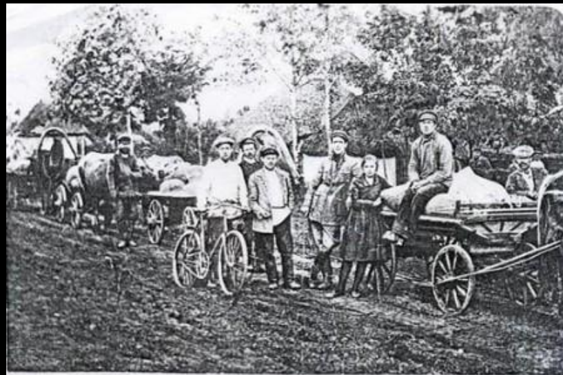
Обоз с зерном, конфискованым у кулаків с. Коломак Валківського району. (30-і роки).