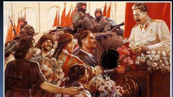
ВЕЛИКИЙ СТАЛИН-ЗНАМЯ ДРУЖБЫ НАРОДОВ СССР!

политика преобразования сельского хозяйства в конце 20х – 30е гг. на основе раскулачивания и насаждения коллективных форм хозяйства (колхозов) с обобществлением значительной части крестьянской собственности.