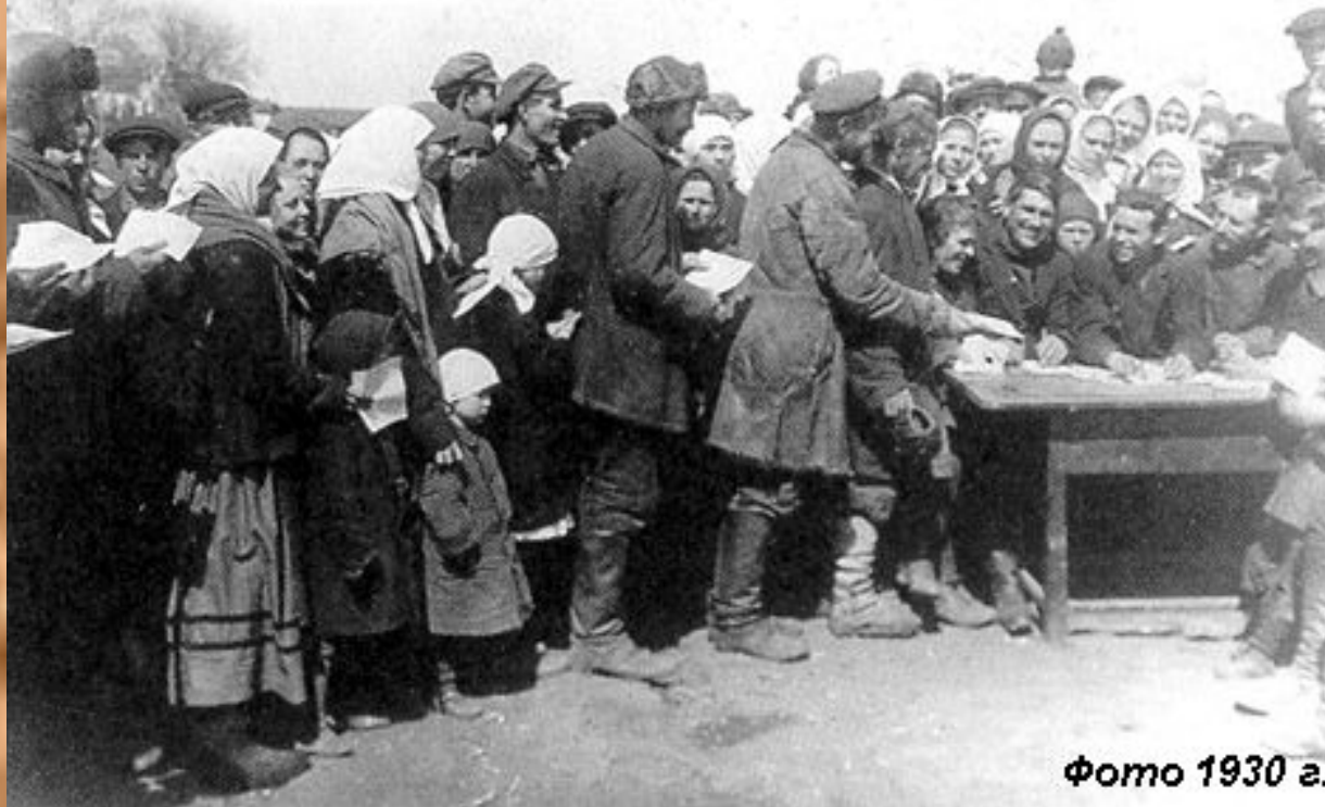
Фото 1930 г.

Крестьяне подают заявления о вступлении в колхоз.