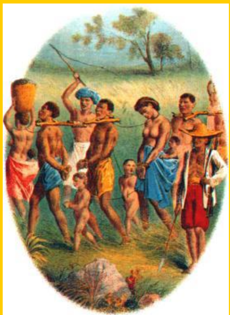
Конвоирование рабов. Современный рисунок.

В 17-18 вв. работорговля перешла к англичанам и голландцам. Их торговые компании держали специальный штат работорговцев и получали на этом колоссальные доходы.