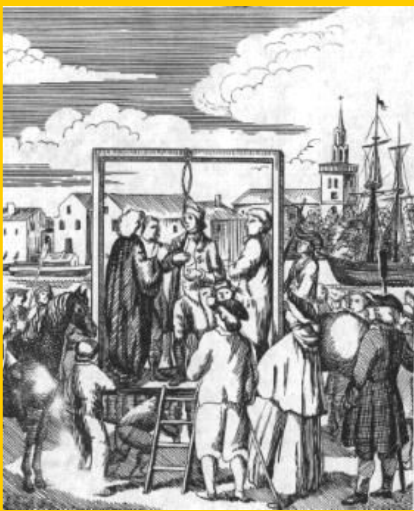
Казнь пирата в Лондоне. Гравюра 16 века.

Джон Морган занимался своим промыслом в Карибском море. Под его началом состояли несколько флотов. С Морганом воевали несколько государств. Особенно от английских пиратов страдали испанцы. Англичане поддерживали Моргана, а губернатор Ямайки был его другом. Затем Морган стал вице-губернатором Ямайки и добился успеха в преследовании своих бывших товарищей-пиратов.