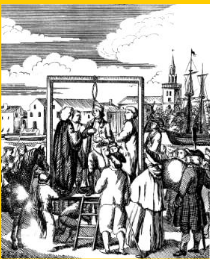
Казнь пирата в Лондоне. Гравюра 16 века.

Джон Морган занимался своим промыслом в Карибском море. Под его началом состояли несколько флотов. С Морганом воевали несколько государств. Особенно от английских пиратов страдали испанцы. Англичане поддерживали Моргана, а губернатор Ямайки был его другом. Затем Морган стал вице-губернатором Ямайки и добился успеха в преследовании своих бывших товарищей-пиратов.