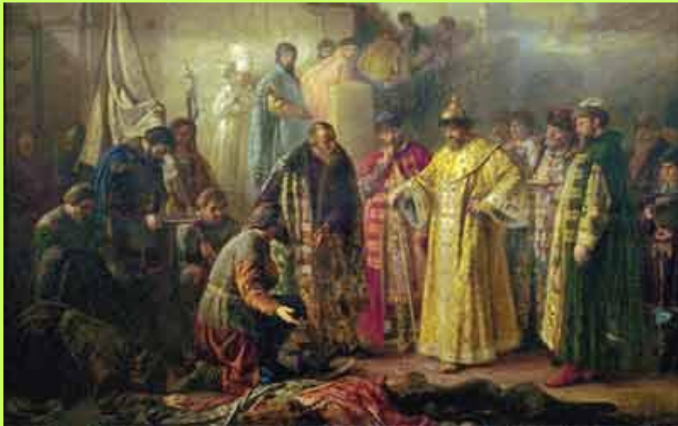
С. Р. Ростворовский. Послы Ермака бьют челом Ивану Грозному