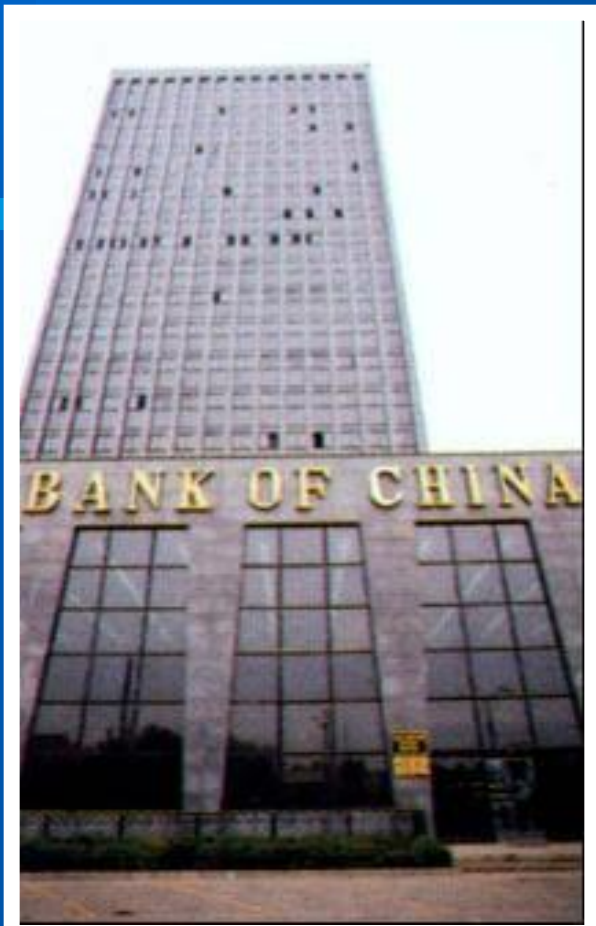
Здание государственного банка

На смену директивной экономике пришло государственное регулирование рынка. Государство помогало предприятиям от которых зависило дальнейшее развитие страны. Успешно развивалась внешняя торговля, появились «открытые экономические зоны», началось проникновение в страну Западного капитала.