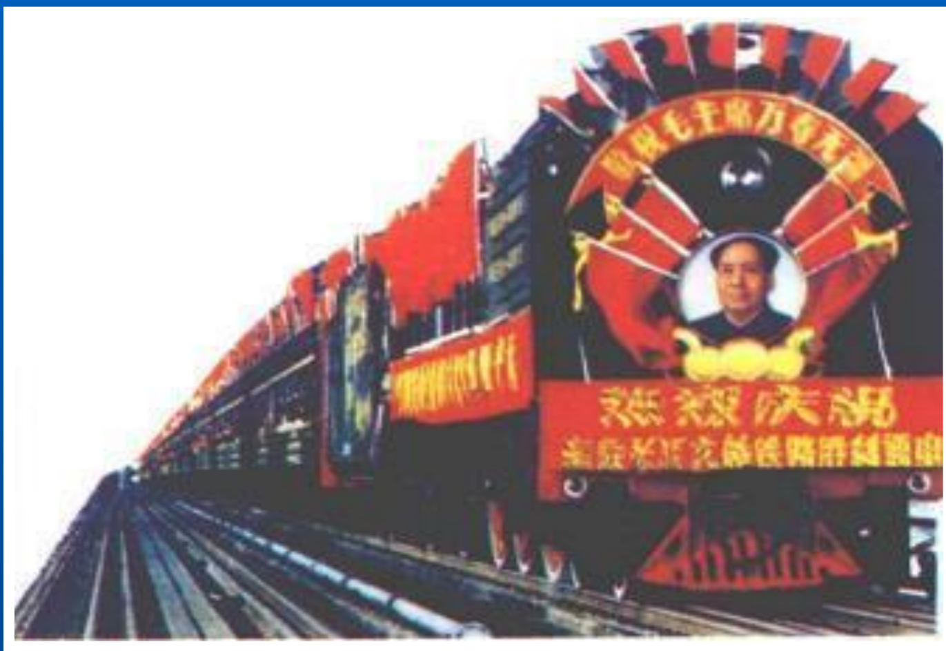
Мао- великий кормчий. Плакат 60-х гг.