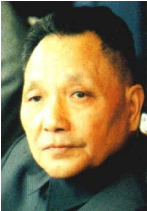
Дэн Сяо Пин

Они разгромили государственные и партийные учреждения, уничтожили ок.30тыс.функционеров.Шаоци был убит, но Ден Сяопину удалось выжить. Были разгромлены,храмы, музеи,библиотеки.