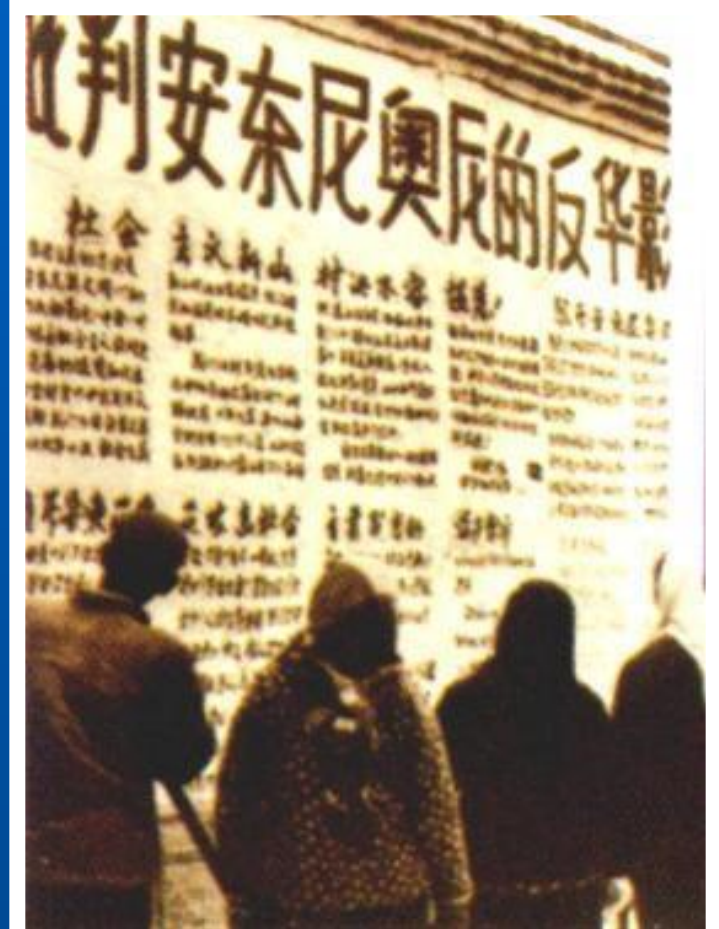
Дацзибао в Пекине.

Все китайцы были объединены в «народные коммуны», где все было поровну. Крестьяне работали на полях и выплавляли металл. В 1959 г. начался острейший кризис.