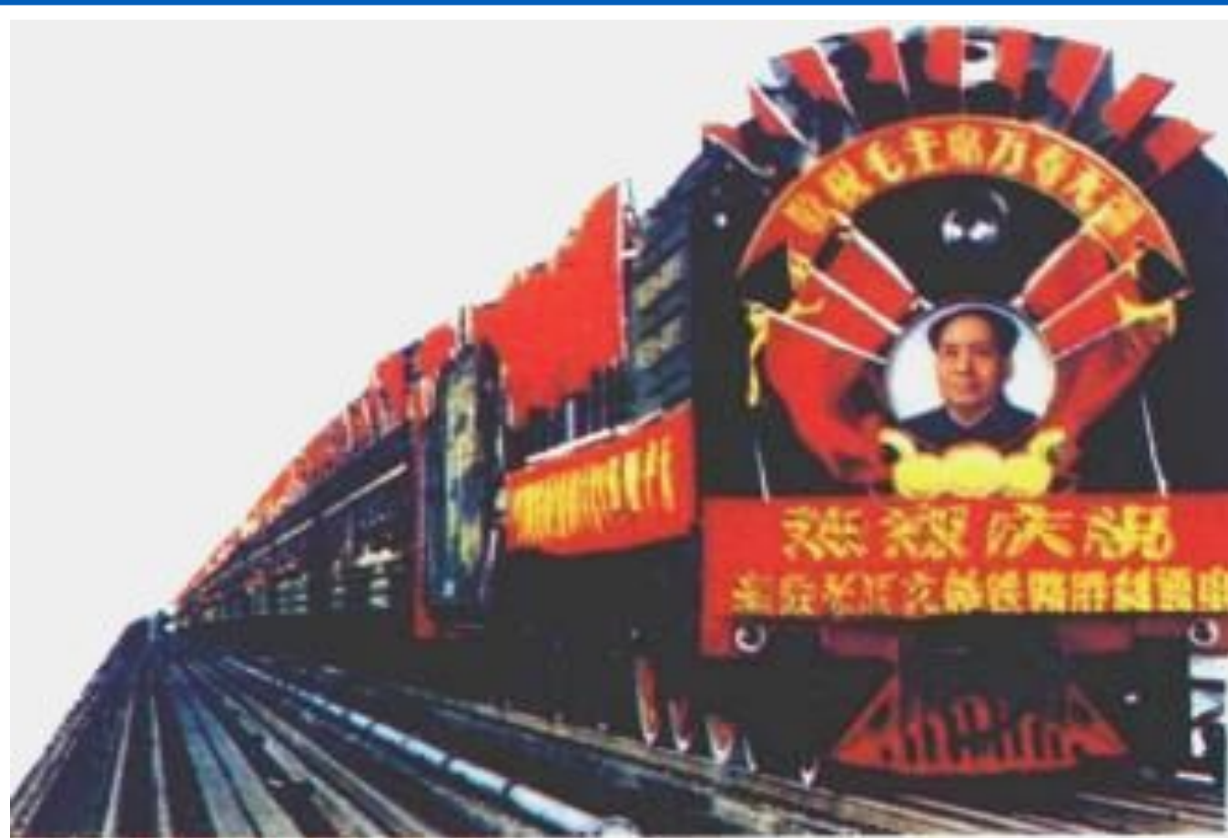
Мао- великий кормчий. Плакат 60-х гг.