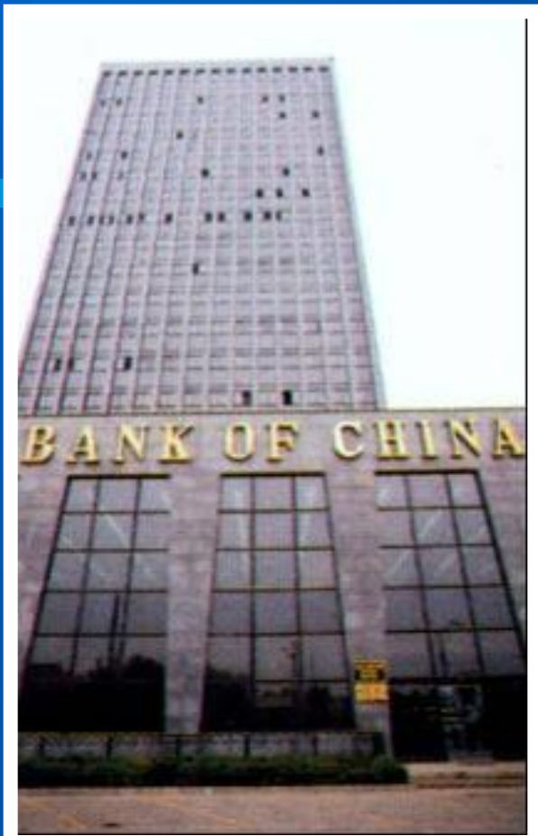
Здание государственного банка

На смену директивной экономике пришло государственное регулирование рынка. Государство помогало предприятиям от которых зависило дальнейшее развитие страны. Успешно развивалась внешняя торговля, появились «открытые экономические зоны», началось проникновение в страну Западного капитала.