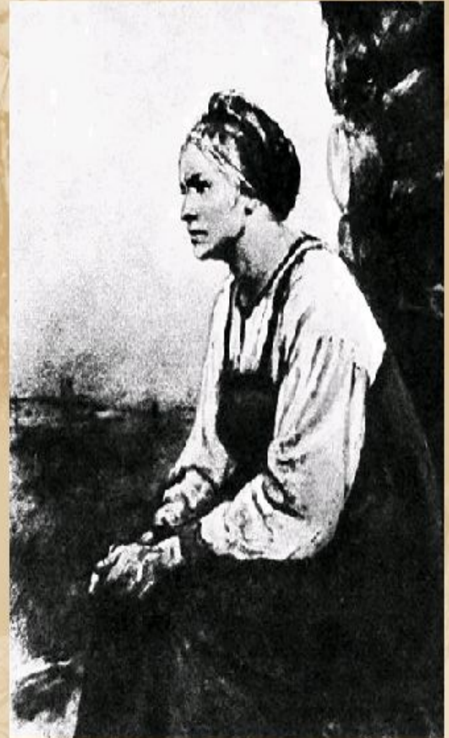
В. Серов. Матрена Тимофеевна. Иллюстрация к поэме Н.А. Некрасова «Кому на Руси жить хорошо» .

От Матрены Тимофеевны герои узнают о Савелии. Это стихийный бунтарь, готовый мстить за народные страдания и страдать за народную месть. Не случайно он внешне напоминает русского былинного богатыря. По складу мышления Савелий - философ. Именно ему принадлежит ключевая «формула», определяющая судьбу мужика на Руси: «Мужчинам три дороженьки: // Кабак, острог и каторга...»