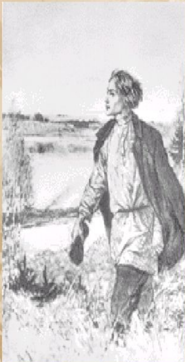
В. Серов. Гриша Добросклонов.

Центральной фигурой заключительной части поэмы является Гриша Добросклонов. В его характере просматриваются черты революционно настроенной молодежи 1860-70-х годов: духовная чистота, доброта, скромность и стремление сделать жизнь народа счастливее. Об этом он вместе с братом Саввою поет в своих песнях: